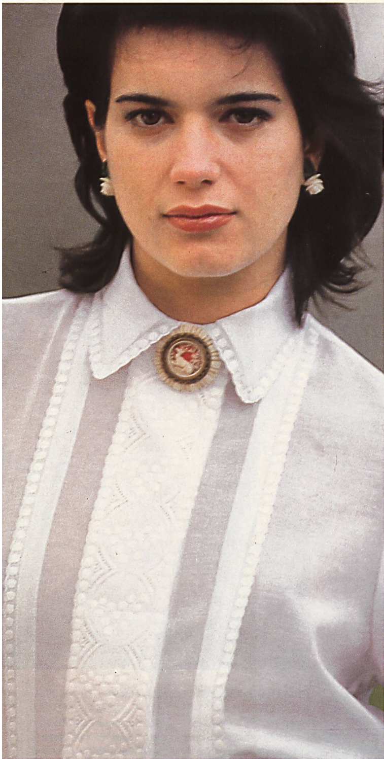
PETER M. GMÜR AG, WIL Feine Stickerei- bänder aus Baum- woll-Voile in ver- schiedenen Breiten zieren diese Bluse aus Baumwoll- Batist / Délicats rubans brodés en voile de coton de différentes lar- geurs, ils décorent ici une blouse en batiste de coton / Pretty embroide- red ribbons in cot- ton voile in various widths as dainty trimmings for this cotton batiste blouse. Mod. Perry Collection