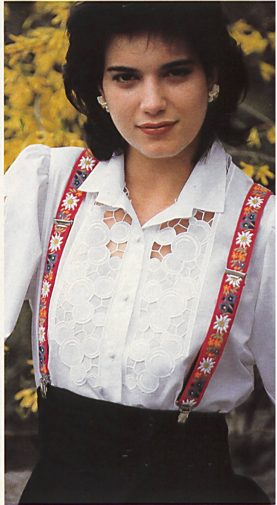
▷ ALTOCO AG, ST. GALLEN Stark durchbro- chene Guipure auf Baumwoll-Voile ist blickfangend in- krustiert auf Front und Ärmeln / Le regard est attiré sur le devant et les manches par une généreuse guipure incrustée en voile de coton / Elabo- rate open-work guipure on cotton voile as eyecatch- ing inserts on front and sleeves. Mod. Rustica of Switzerland