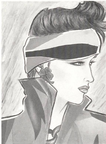
Titelbildgestaltung von Ursula Rodel mit Stoffen von Christian Fischbacher Co. AG St. Gallen