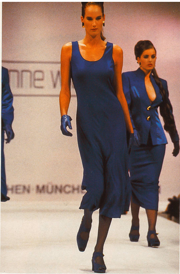
Crêpe und Satin von Schubiger und Schwarzenbach