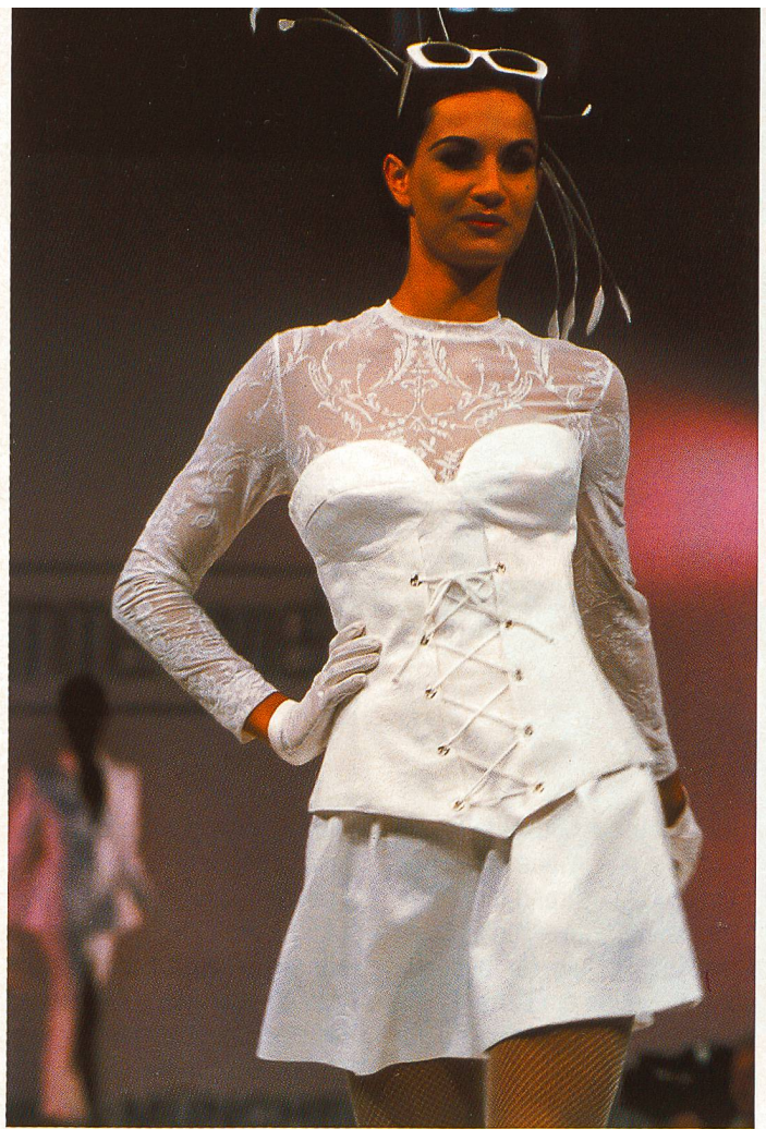
Stoff von Corsage und Rock: Fischbacher

"Prêt-à-Couture" nennt die Designerin im Mix der Begriffe Prêt-à-porter und Haute-Couture ihre Handschrift. Ganz unkonventionell geht sie an anspruchsvolle Materialien heran, gibt ihnen mit einer Prise Ironie eine spielerische Note. "Nur nicht zu ernst, nur nicht zu normal, denn sonst kommt Langeweile auf."