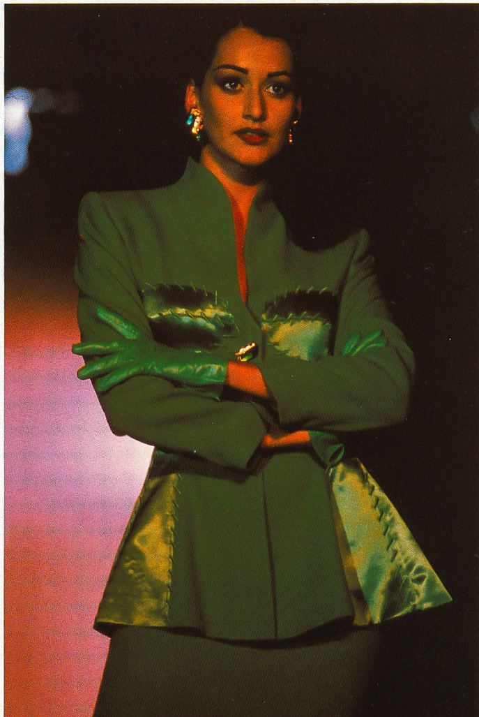
Crêpe von Stehli, Satin von Weisbrod-Zürcher