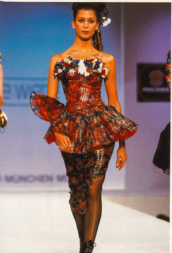
Material von Schlaepfer