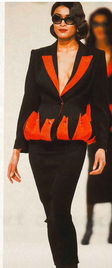
Stoffe von Stehli und Weisbrod Zürrer (Moiré)