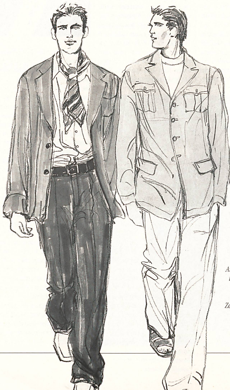
Software – der lässig lockere Stil in der Interpretation des Anzugs von Paul Smith und der Hemdjackenkombination von Dries van Noten. Zeichnung Christel Neff.

dertradition verpasst Oswald Boateng, der junge schwarze Designer aus London, dem Nadelstreifenanzug knallige Farben. Minimalistische Form verbindet der Ire John Rochas mit barocken Dessins, während Kenzo mit afrikanischen Drucken und indischen Styling-Anleihen einen dekorativen Ethno-Touch und die warmen Farben der dunklen Rot-, der satten Ocker- und erdigen Braunschattierungen ins facettenreiche Modebild einbringt.