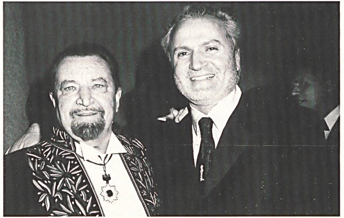
Maurice Béjart und Gianni Versace

Modebühne war für Gianni Versace immer auch Theaterbühne, sein modisches Gestaltungsprinzip spiegelte sich im Theaterkostüm, und die dramatische Geste prägte mitunter eine Kleididee. Denn dem Theater, dem Musiktheater zumal, gehörte nebst der Mode seine grosse Liebe. Die Scala in Mailand führte ihn als Kostümbildner in so unterschiedlichen Opernproduktionen auf wie Donizettis «Don Pasquale», Massenets «Hérodiade» oder in der aufsehenerregenden Salome-Interpretation von Bob Wilson, der die Sängerdarsteller im Vordergrund mit einer zweiten tänzerischen Ebene doppelte.