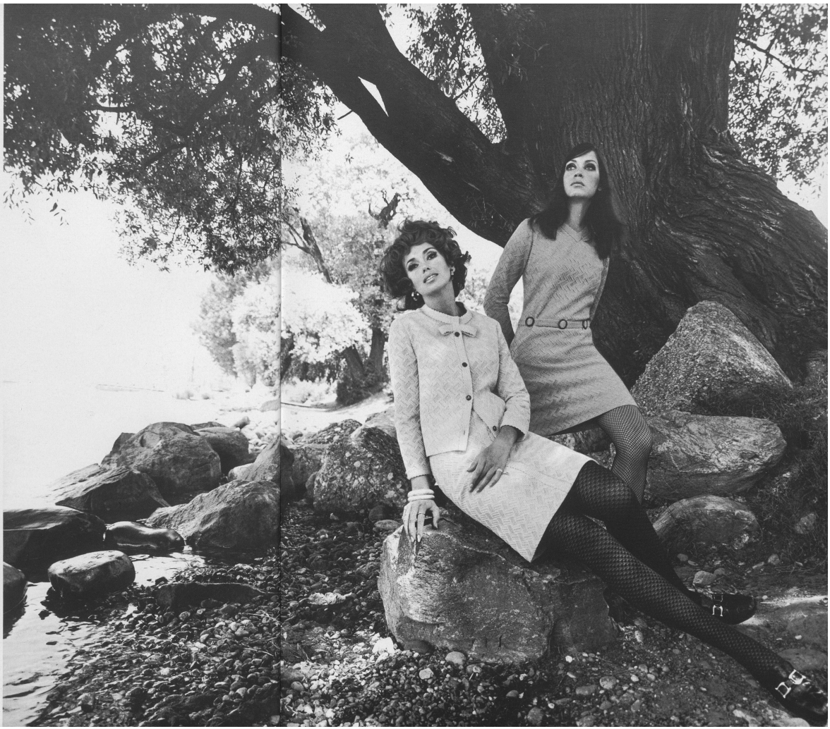
HANDSCHIN & RONUS AG Left: Charming "corded" structure two-piece outfit with straight collar and bow. Right: Versatile sporting dress with a fashionable V-neck and original belt; in wool polyester corded fabric.