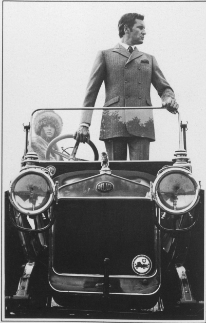
RITEX AG Zweireihiger Anzug mit schräggestellten Pattentaschen, modisch hochgestellter Knopffront und langgezogener Silhouette.