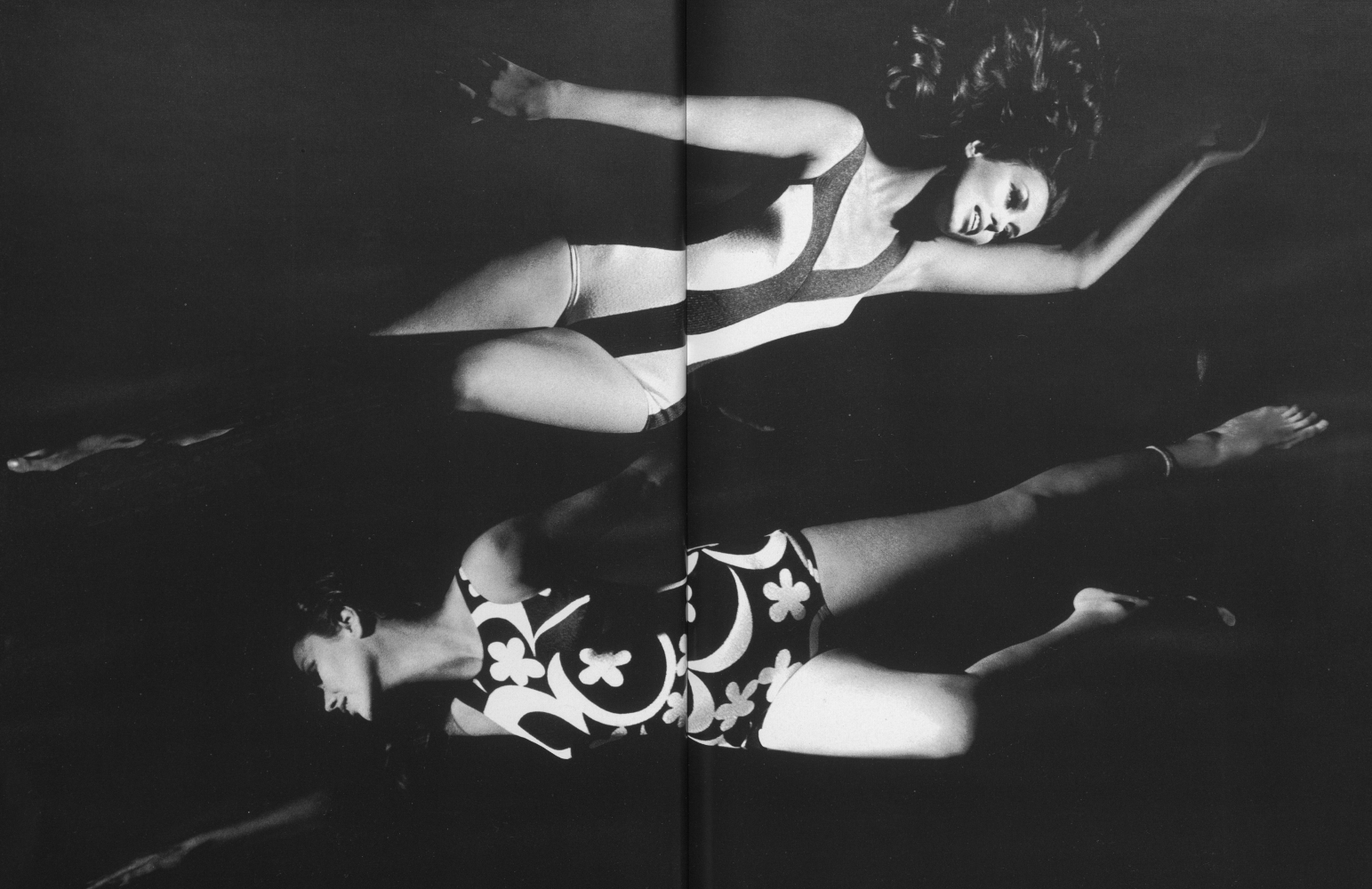
74 Oben: PIUS WIELER SÖHNE AG Modischer Damenbadeanzug braun/weiß, aus kontrastierendem Material mit ebenso kontrastreicher Struktur.