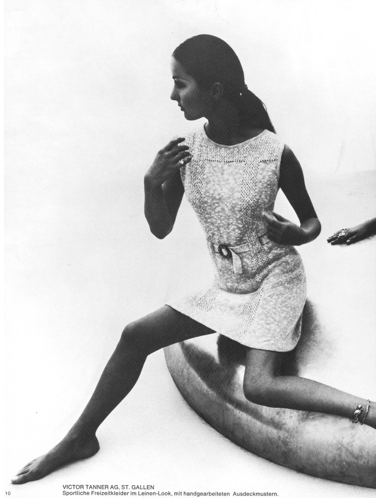
VICTOR TANNER AG, ST. GALLEN Sportliche Freizeitkleider im Leinen-Look, mit handgearbeiteten Ausdeckmustern.