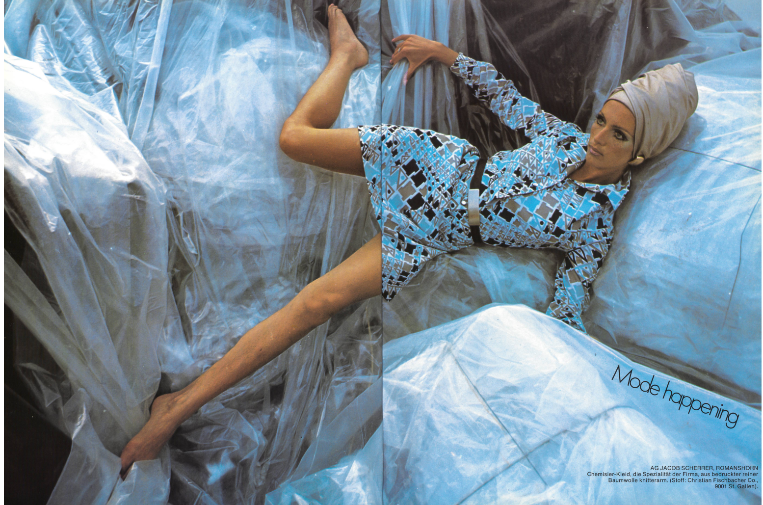
AG JACOB SCHERRER, ROMANSHORN Chemisier-Kleid, die Spezialität der Firma, aus bedruckter reiner Baumwolle knitterarm. (Stoff: Christian Fischbacher Co., 9001 St. Gallen).