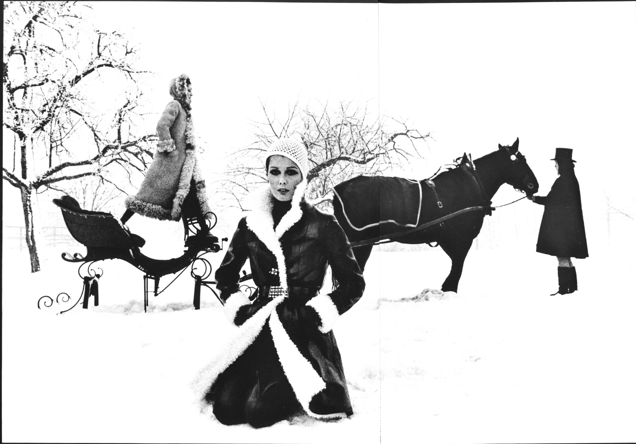
HEINZ KARASEK AG, ZÜRICH Left: Beige «bumpy» maxi-coat, in long curly-haired sheepskin, with hood. Right: Fashionable waisted sporty coat, in black wrinkled patent leather.