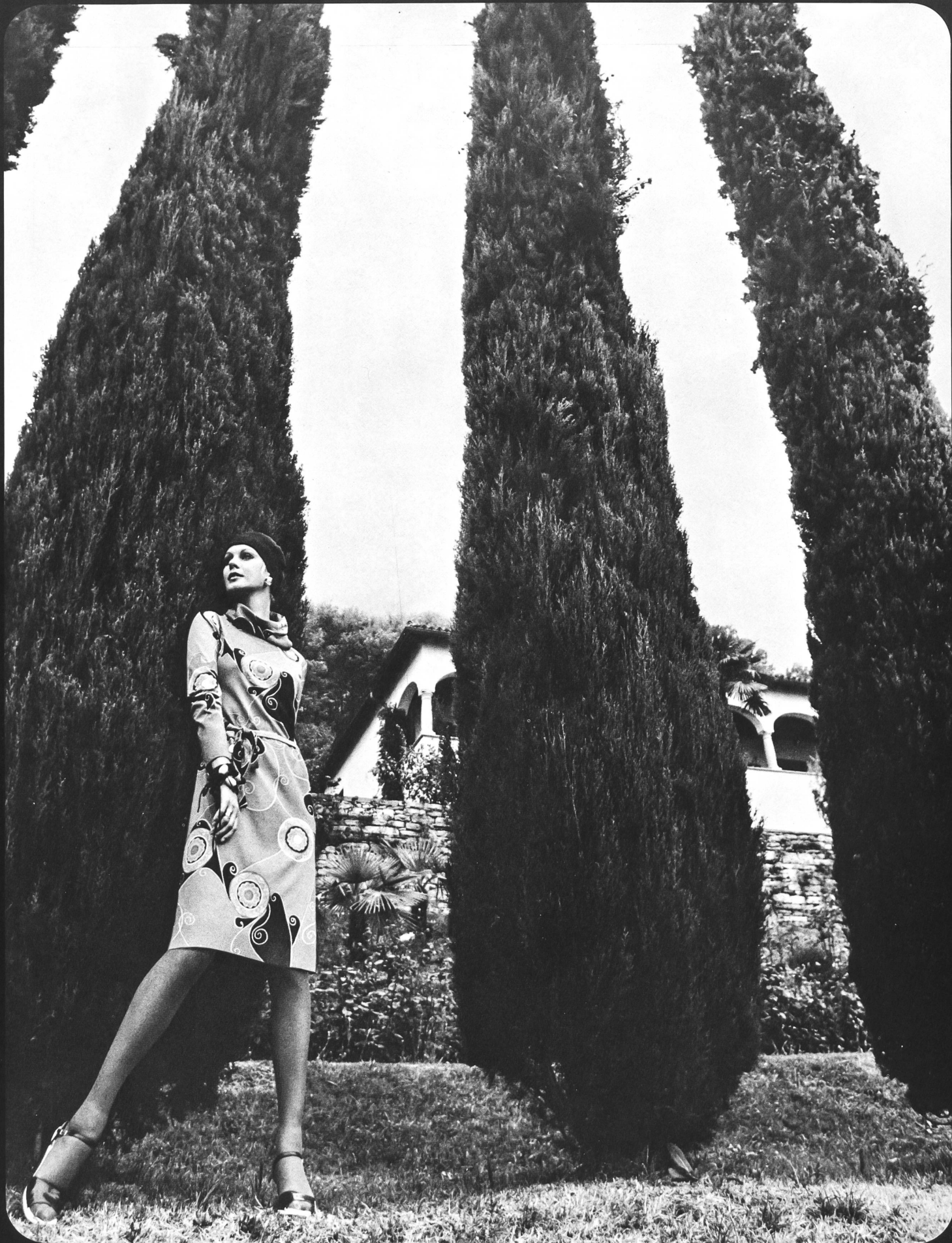
LA MAILLE S.A., LAUSANNE Élégante robe d'après-midi en jersey de polyester imprimé.