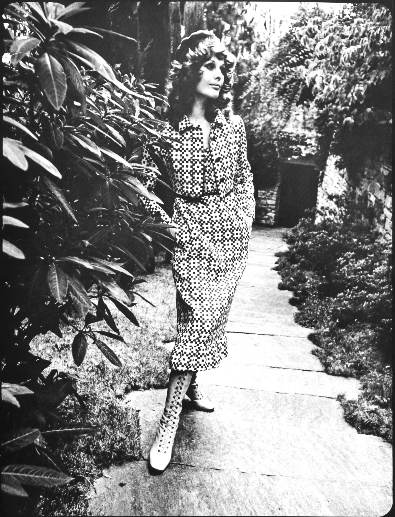
4 R. CAFADER & CO., ZÜRICH Élégant ensemble jeune: robe midi avec jaquette, en pur coton imprimé. (Tissu: L. Abraham & Cie Soieries S.A., Zurich)