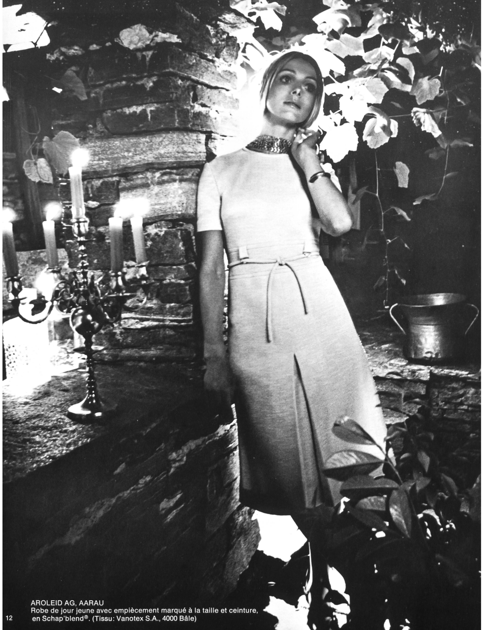
AROLEID AG, AARAU Robe de jour jeune avec empiècement marqué à la taille et ceinture, en Schap'blend®. (Tissu: Vanotex S.A., 4000 Bâle)