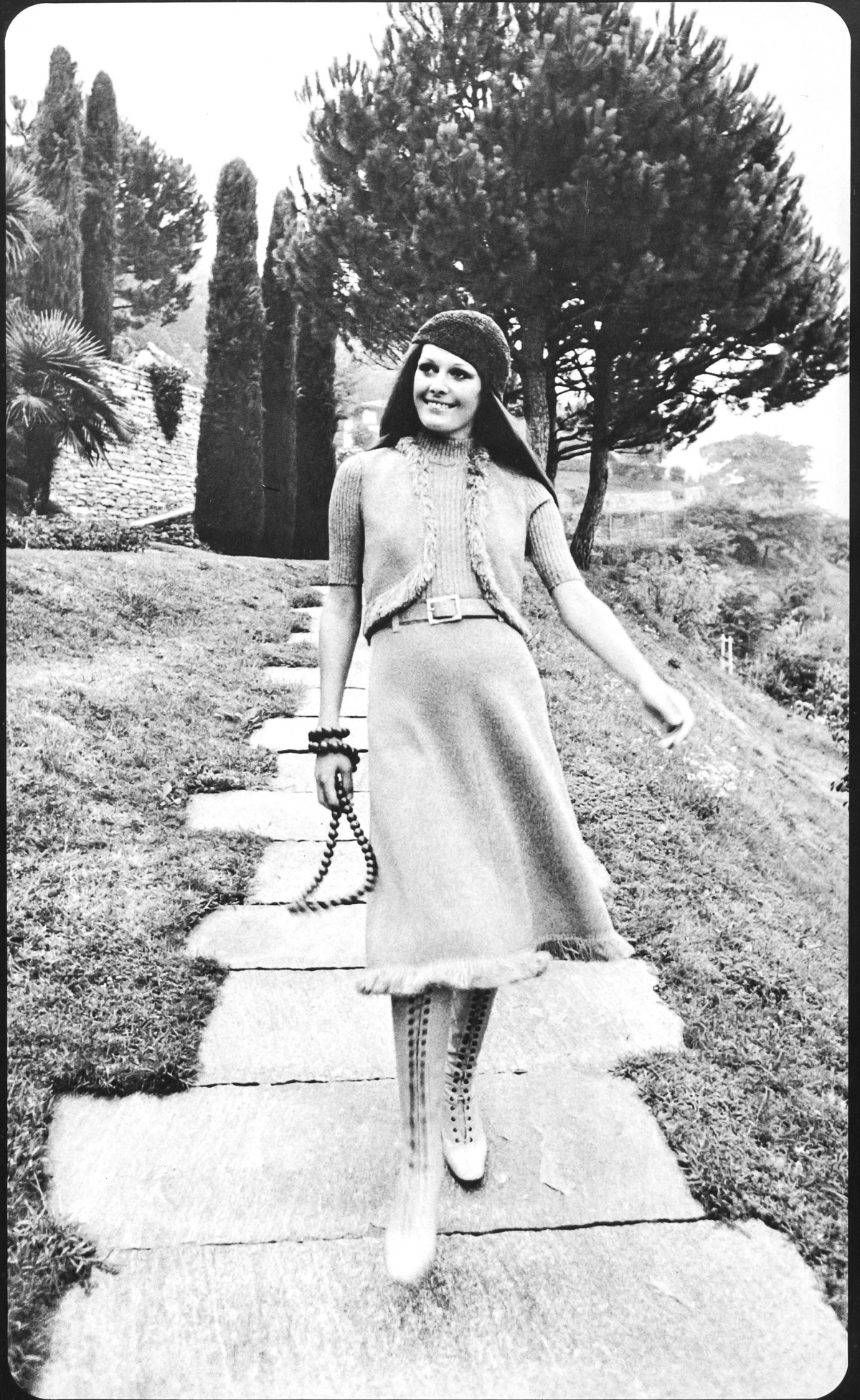
HUMBERT-ENTRESS AG, AADORF Robe mode à boléro, en Lismeran® retors, avec garniture de franges.