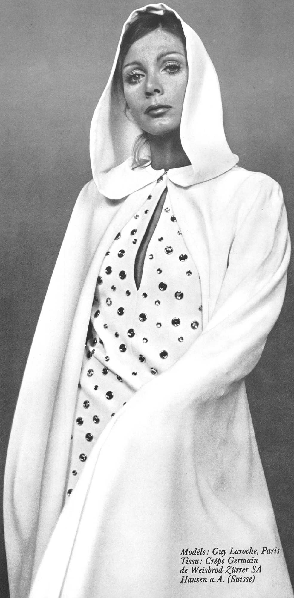
Modèle: Guy Laroche, Paris Tissu: Crépe Germain de Weisbrod-Zürcher SA Hausen a.A. (Suisse)