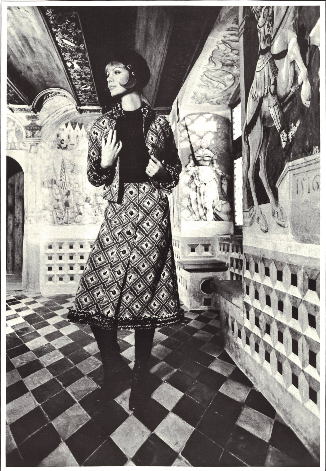
Trois-Pièces aus reinwollenem Jacquardwevenit mit passender Schlingenbordüre. Assortierter Pullover in abgestuften Farben ● Trois-pièces en wevenit jacquard pure laine, avec bordüre en galon bouclé assortie. Pullover assorti en tons dégradés ● Three-piece outfit in pure wool jacquard wevenit with attractive looped edging. Matching pullover in muted shades