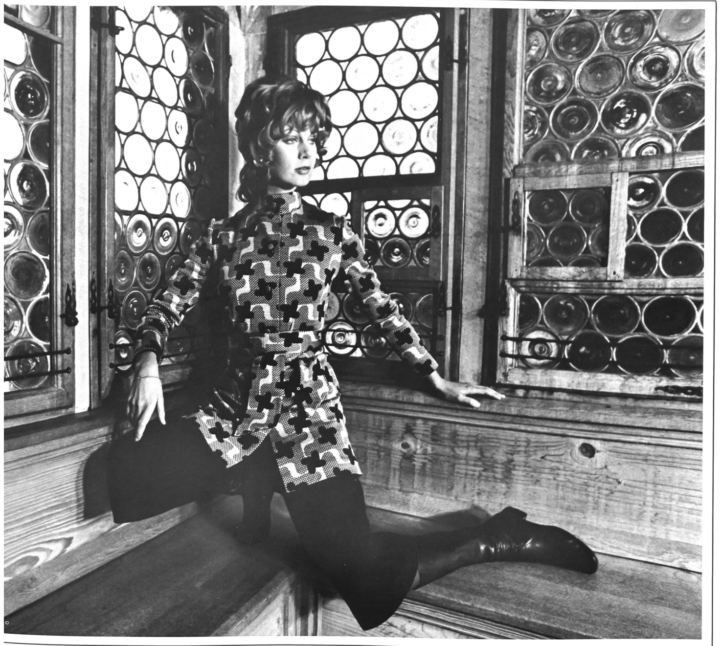
Hosensembles: Kasak aus Jacquard-Jersey reine Seide, Dreiviertel-Hose aus reiner Schurwolle • Ensemble pantalon: casaque en jersey jacquard pure soie, agréable au porter, et pantalon \frac{3}{4} en pure laine vierge • Trouser-suit: casaque in pure silk jacquard jersey, three-quarter length trousers in pure virgin wool