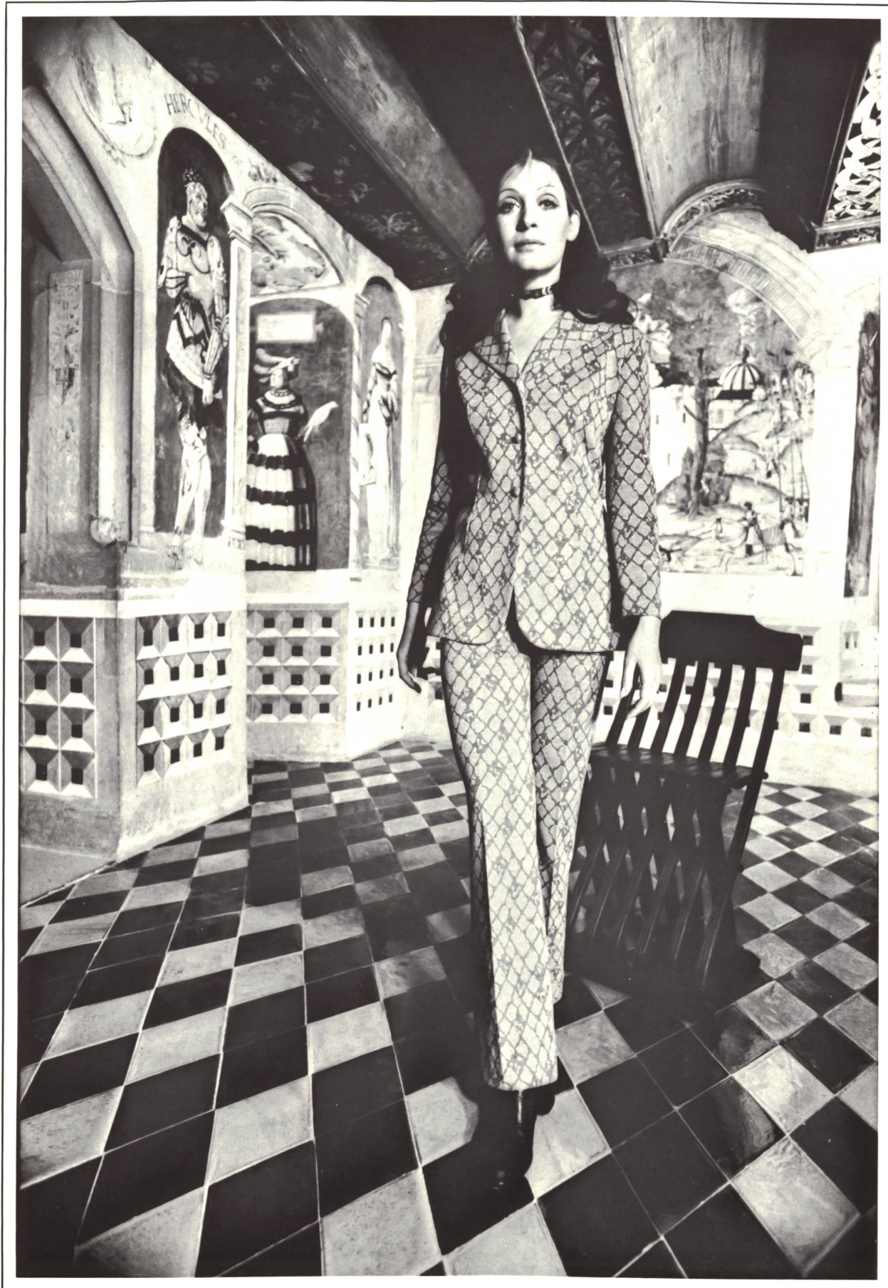
Fantasia-Hosenensemble aus Jacquard-Jersey Tersuisse®-Mélanie • Ensemble pantalon fantasia en jersey jacquard de Tersuisse®-Mélanie • Original pant-suit in Tersuisse®-Mélanie jacquard jersey