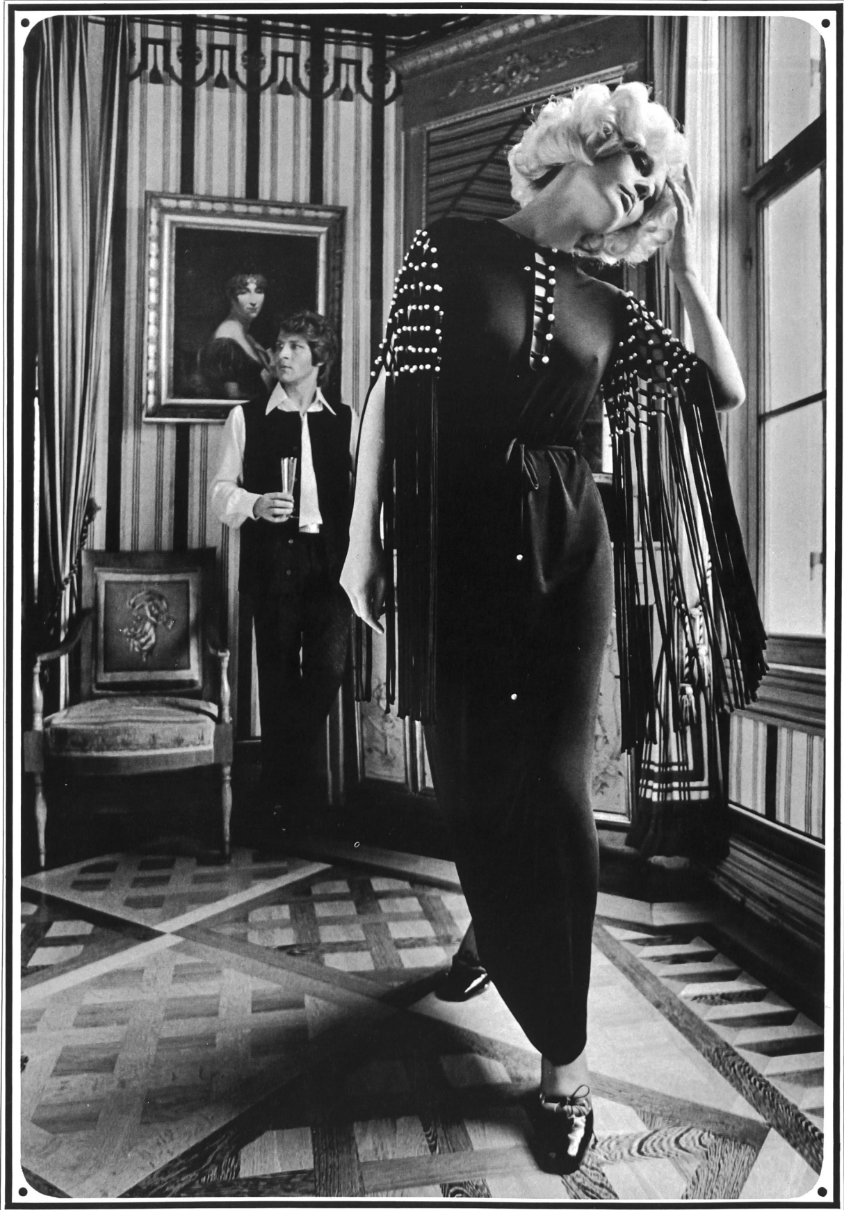
CREATIONS POLLA, BARICO DI CROGLIO

P arty-Kleid aus feinem seidigen Jersey, mit Perlenstickerei ● Robe pour parties, en fin jersey soyeux, avec broderie de perles ● Party dress in fine silky jersey, with pearl embroidery ● Stoff/tissu/fabric: Tersuisse® Travel-Star: Robt. Schwarzenbach & Co., 8800 Thalwil