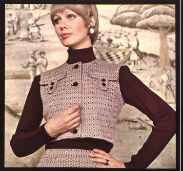
Hochmodischer Hosenrock aus reinwollenem Wevenit-Jacquard, mit kurzem, ärmellosem Bolero, kombiniert mit sportlichem Rippenpullover • Jupe-culotte en tricot wevenit jacquard pure laine, avec court boléro sans manches et pullover sport à côtes • Divided skirt in pure wool wevenit jacquard tricot, with short sleeveless bolero and sporty ribbed pullover