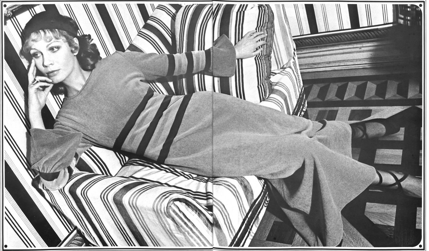
A. NAEGELI AG, WINTERTHUR

Chemise-Kleid aus Baumwoll-Velours, in Empire-Form mit eingestrichelter Streifenarmatur • Robe coin de feu en velours de coton, forme empire, avec bandes incrustées • Fireside dress in cotton velvet, Empire style with striped inserts