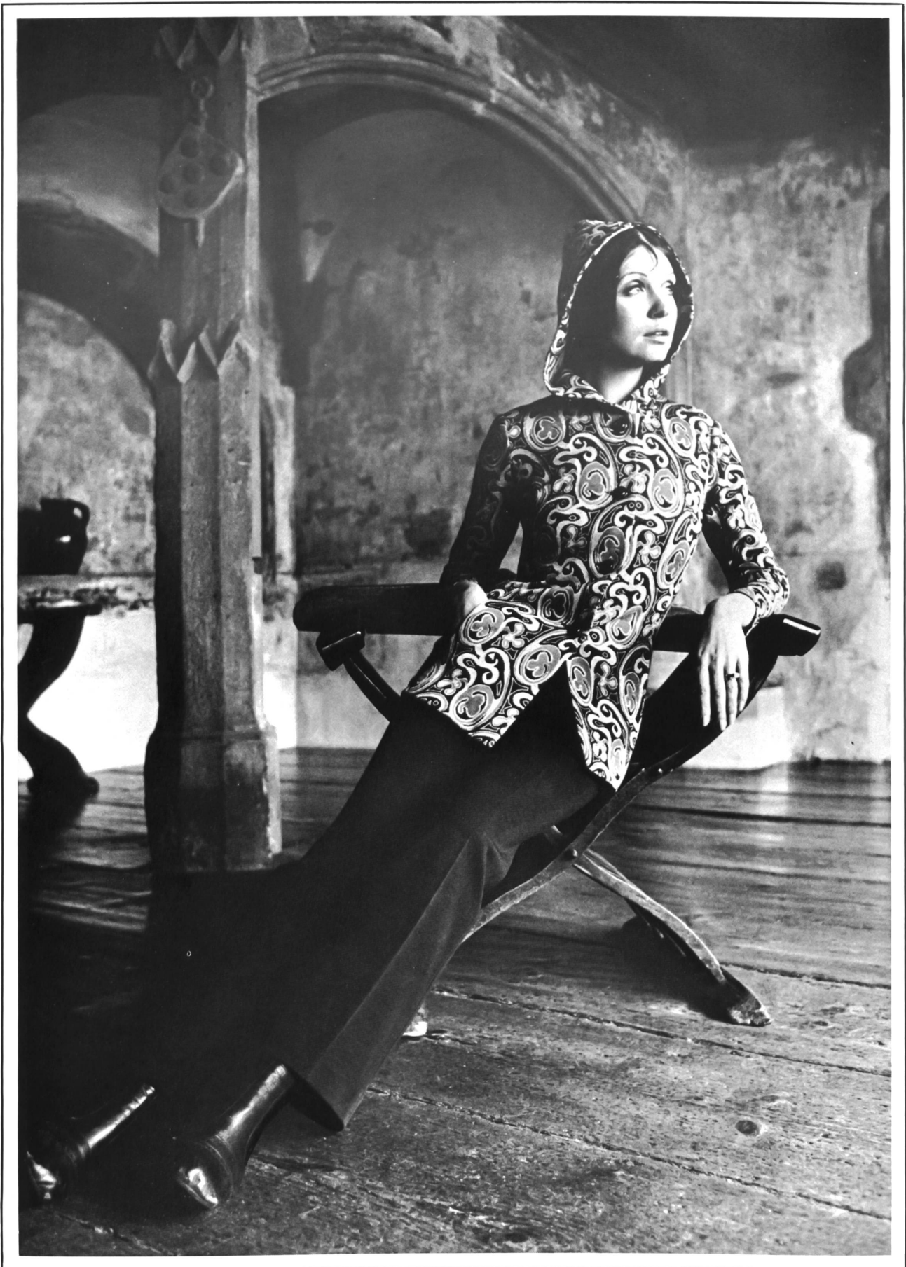
Sportlicher Kasak mit Kapuze, grosszügiges Jacquard-Muster, dazu uni Hose aus reiner Schurwolle; geeignet für Skiferien und Freizeit • Casaque sport à capuchon, en grand dessin jacquard, avec pantalon uni en pure laine vierge; modèle pour vacances de ski et loisirs • Sporty casaque with hood, in large jacquard design, with plain pants in pure virgin wool; model for ski holidays and leisure wear