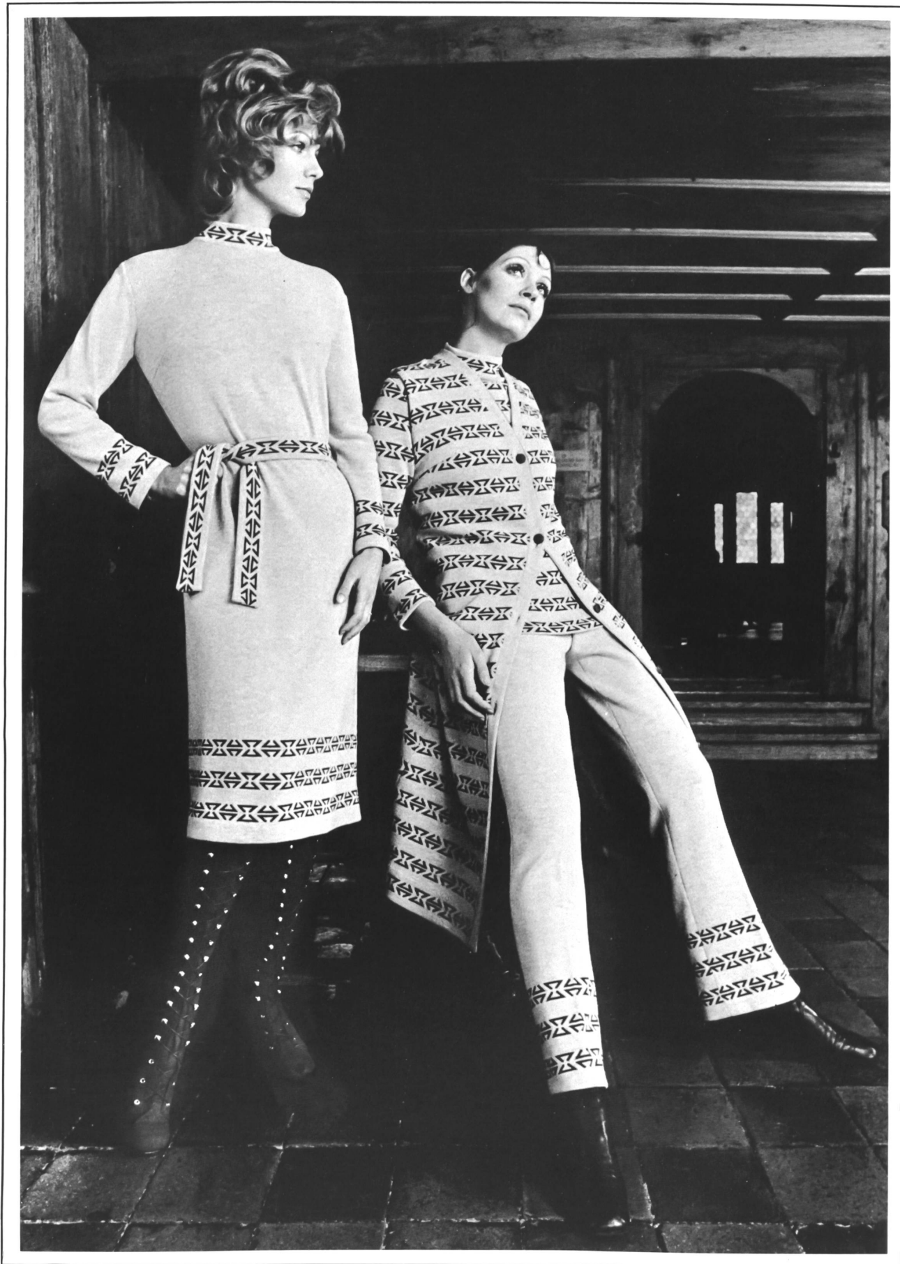
Hosenensemble mit Chasuble in exklusivem Dessin und sportlich elegantes Nachmittagskleid. Beide Artikel aus reiner Schurwolle • Ensemble à pantalon et chasuble, à dessin exclusif, et élégante robe sportive d'après-midi. Les deux articles en pure laine vierge • Trouser suit with chasuble in exclusive design and attractive casual afternoon dress. Both articles in pure virgin wool