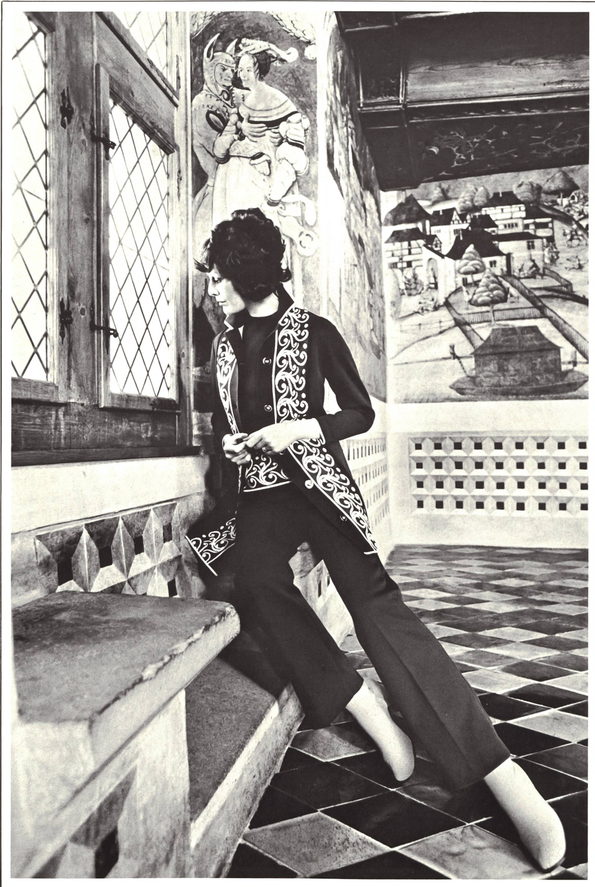
Sportliches Tersuisse®-Hosensembles mit originellem Zierdessin auf langer Jacke mit Pullover • Ensemble sport à pantalon en Tersuisse® avec original dessin sur la jaquette longue et le pull • Sporty Tersuisse® trouser-suit with attractive original design on long jacket and pullover