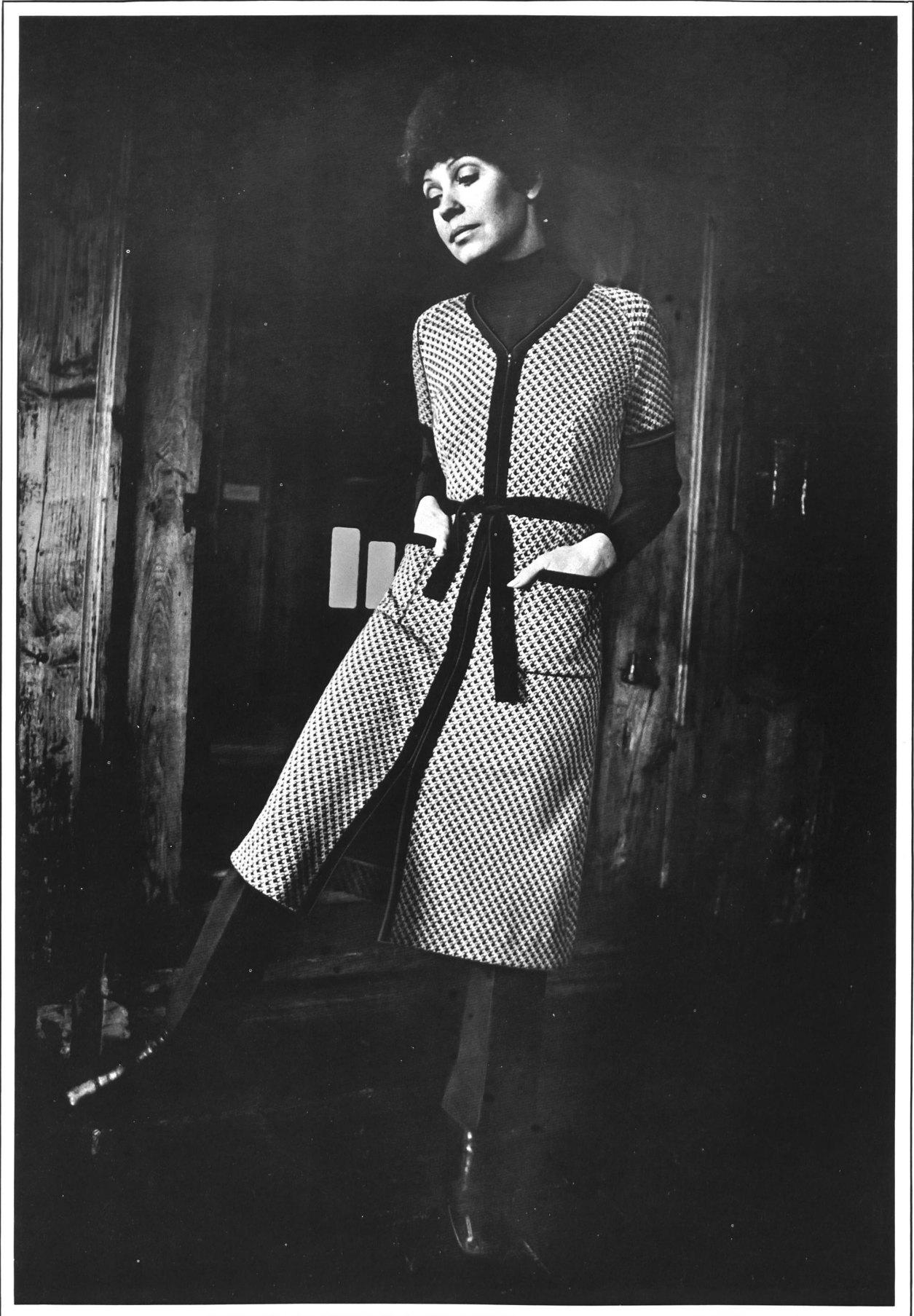
Midilanges, Jacquard-gestricktes Trois-Pièces aus reiner Schurwolle, mit uni Pullover • Trois-pièces midi en tricot jacquard, avec chandail uni, en pure laine vierge • Midi-length, jacquard knitted three-piece outfit in pure virgin wool, with plain pullover