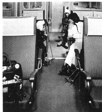
Luzern-Stans-Engelberg-Bahn Chemin de fer Lucerne-Stans-Engelberg Luzern-Stans-Engelberg Railway Ferrovia Lucerna-Stans-Engelberg

Les autorités scolaires, les compagnies de chemins de fer et de navigation ont pu se rendre compte des avantages précités et d'autres encore. La Compagnie de navigation sur le lac des Quatre-Cantons a fait poser un tapis de Nylsuisse® dans le restaurant de son nouveau bateau, le « Gotthard », le Chemin de fer Lucerne-Stans-Engelberg a fait garnir les compartiments de première classe de ses nouveaux wagons de tapis, comme l'Ecole normale Rothen, près Lucerne, en a fait poser dans les chambres des maîtres, les salles de séances et de classe, sans oublier la bibliothèque. Et, depuis quelques jours, un tapis de Nylsuisse® orne la grande salle de séances du Palais fédéral à Berne, tapis tissé à la Fabrique de tapis de Melchnau S.A. , et dont la Société de la Viscose Suisse à Emmenbrücke a fait présent au gouvernement helvétique.