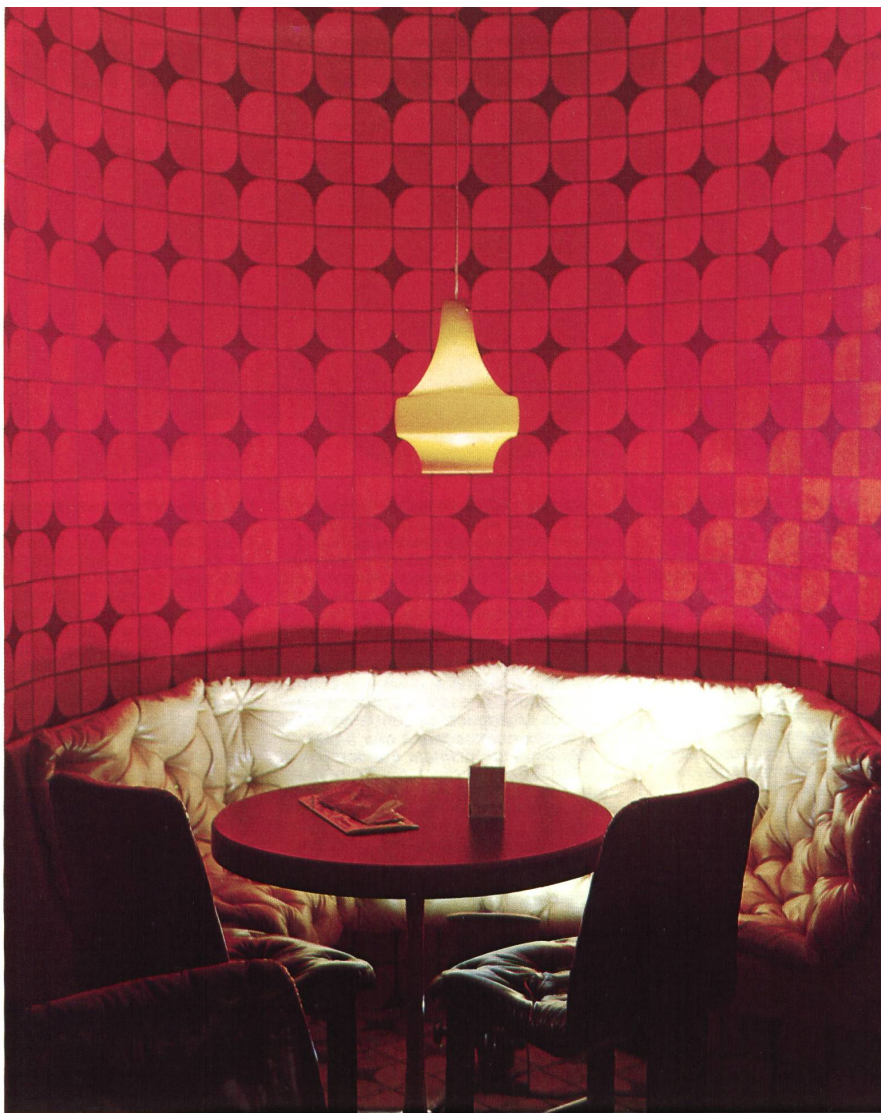
Des. 5322/100 Qual. Nylvelour 732 Unter Des. 0444 in Wolle erhältlich. Aussi en laine sous Des. 0444. Also available in wool under Des. 0444. Anche di lana sotto Des. 0444.