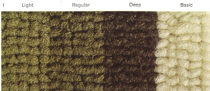
Färbung mit Säurefarbstoff Teinture avec colorant acide