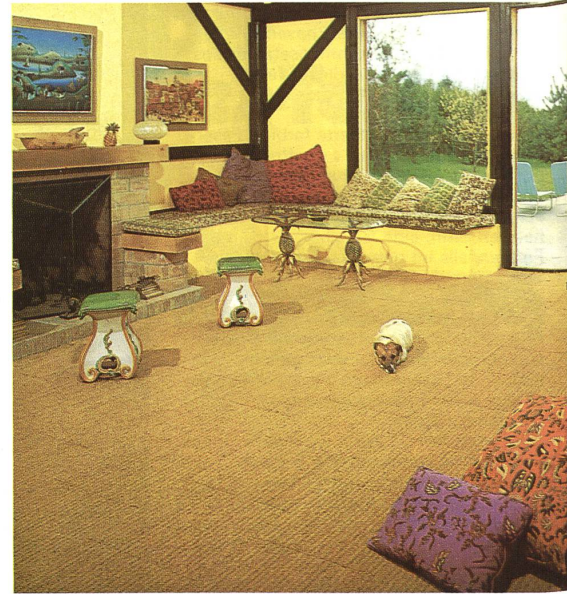
Tahiti in Platten von 50 x 50 cm mit Waffelrücken. Tahiti en plaques de 50 x 50 cm, avec dessous gaufré. Tahiti in 50 x 50 cm squares with honeycomb backs. Tahiti in lastre da 50 x 50 cm, con rovescio a nido d'api.