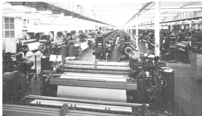
Broad loom for sheets Breite Webmaschinen für Betttücher

fektioniert man auch Bettwäsche mit Stickerei-Besatz. Natürlich wird das umfangreiche Bezugssortiment durch die assortierten Betttücher abgerundet, wobei das Unternehmen auch hier auf seine Spezialitäten nicht verzichtet und zusätzlich manchem Kundenwunsch entgegenkommt, was durch die eigene grosse Konfektionsabteilung — Bettwäsche wie Taschentücher — ermöglicht wird. Wie schon erwähnt, pflegt die Firma eine erfreuliche Zusammenarbeit mit einer andern Heimtextilienfabrik zur beidseitigen Bereicherung des Sortimentangebots, eine Entwicklung, die noch vor wenigen Jahren unter « Konkurrenten » nicht denkbar gewesen wäre. Heute vertieft eine solch weitblickende Geschäftspolitik die Beziehungen zur weltweiten Kundschaft, die das modische Qualitätsprodukt, verbunden mit echter Dienstleistung, zu würdigen weiss.