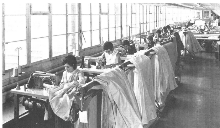
Ready made department: making hems for sheets Konfektions-Abteilung: Säumen von Betttüchern

● Per la versione italiana vedasi pagine « Traduzione ».