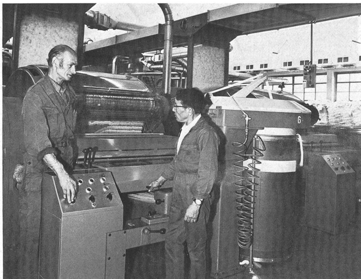
1 Filature: machine de préparation à haut rendement Hochleistungsmaschine aus den Vorwerken der Spinnerei High-speed machine in the pre-spinning department Macchina ad alto rendimento per la fase preparatoria del tessificio