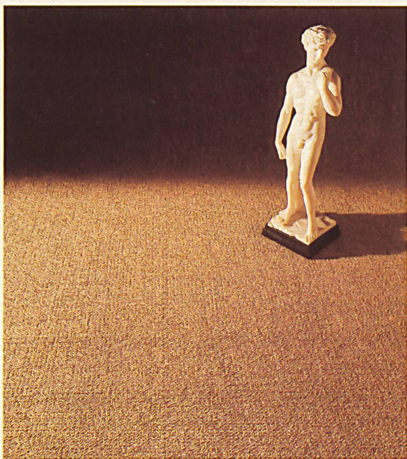
Alpina « Herkules »