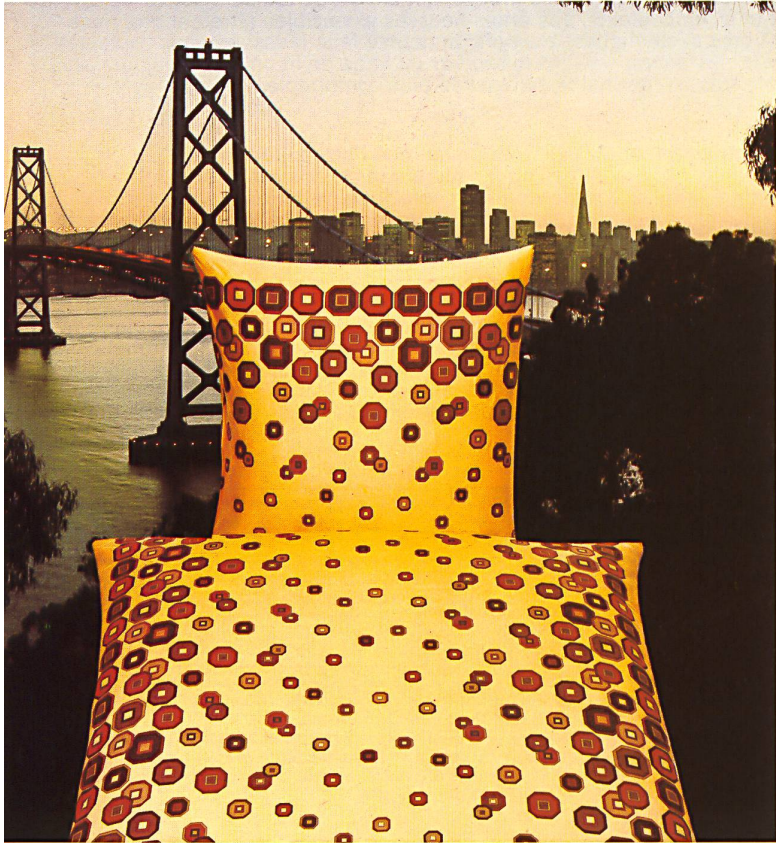
Satin « Silka » aus 100 % Baumwolle / en 100 % coton / in 100 % cotton / Raso « Silka » di 100 % cotone.