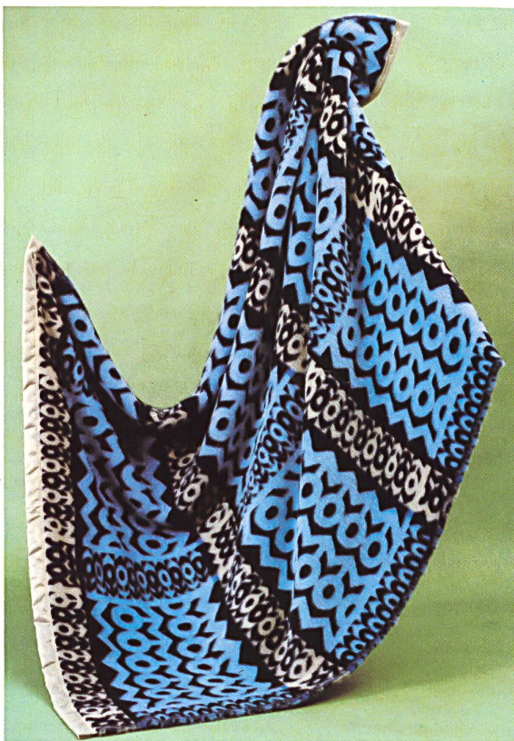
SCHWEIZERISCHE DECKEN- UND TUCHFABRIKEN AG, PFUNGEN