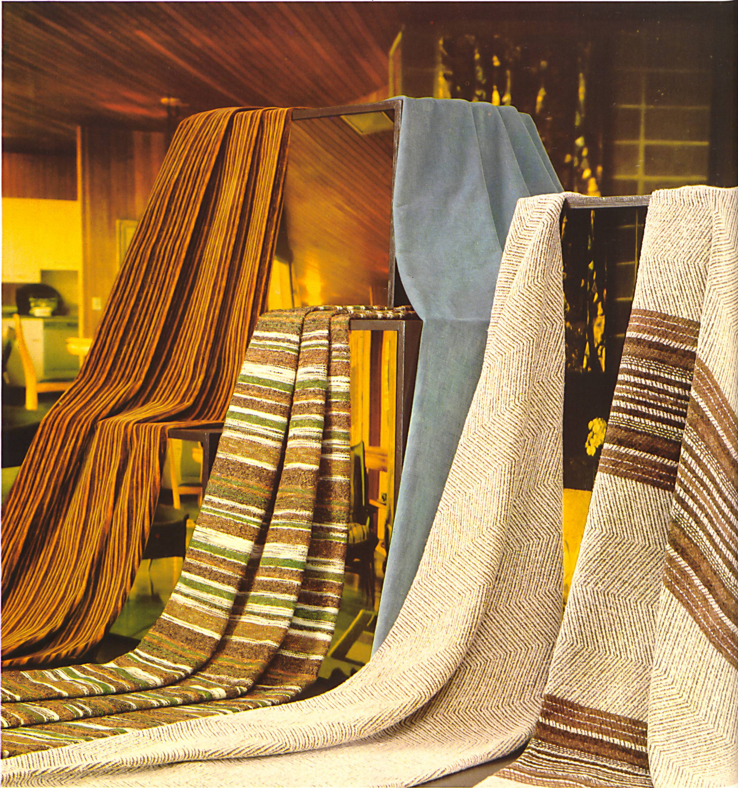
Möbelstoffweberei am Bachtel, J. C. Schellenberg AG, Hinwil