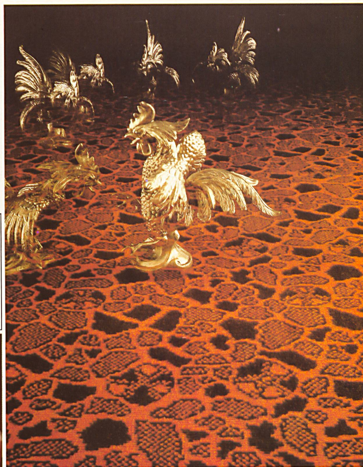
Alpina / GIGANT JACQUARD MURANO