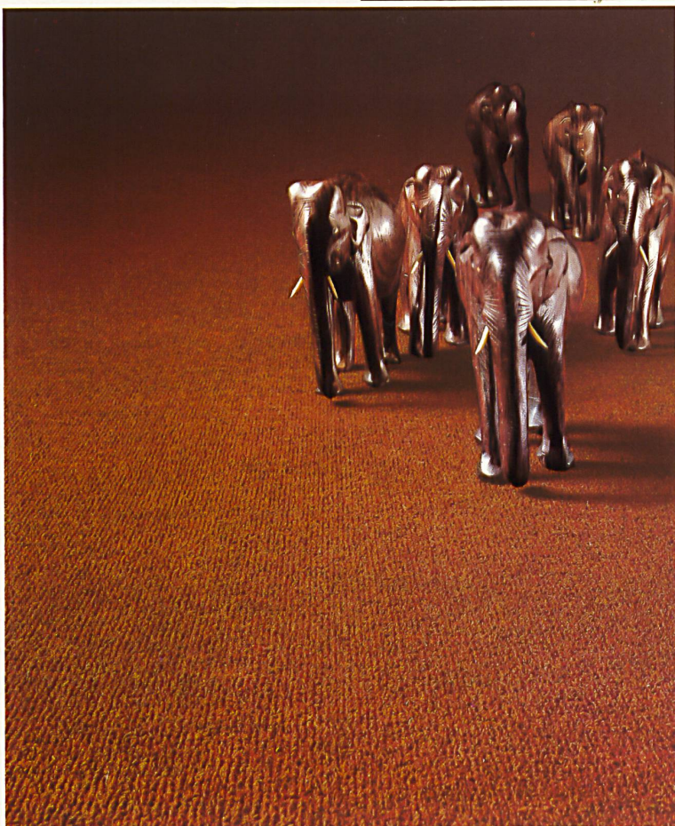
Alpina / GIGANT RIPS