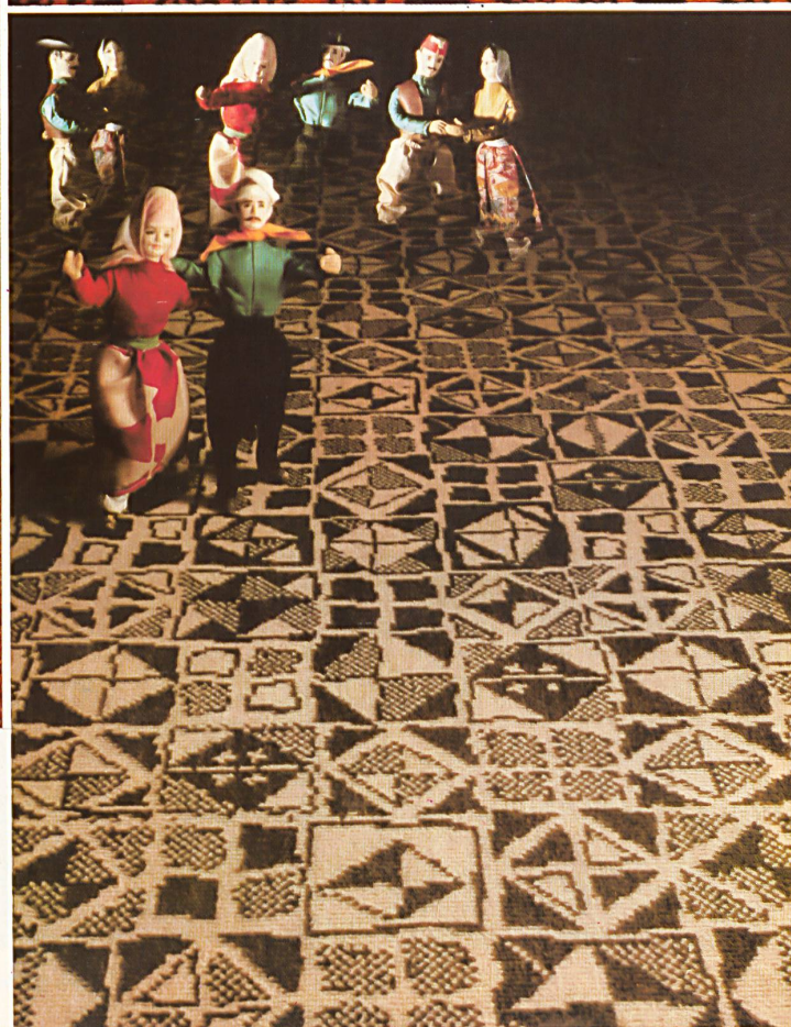
Alpina / GIGANT JACQUARD INKA