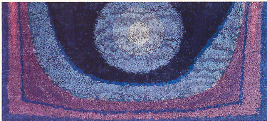
Design: John Rüd Reine Schurwolle (Wollsiegel-Qualität), handgeknüpft / Pure laine vierge (qualité Woolmark), noué main / Pure new wool (Woolmark quality), hand-knotted / Pura lana vergine (qualità sigillo lana), annodato a mano. (Katholische Kirche, Meilen)

■ Negli ultimi anni l'arte tessile ha ritrovato espressioni e dimensioni nuove. Molti artisti, invece che al pennello, fanno appello al telaio oppure alla pistola per filati, onde creare, mediante tecniche svariate, nuove immagini tessili. Spesso gli stilisti fissano le loro idee sulla carta e lasciano all'esperto della pratica il compito di realizzare il lato tecnico dell'opera.