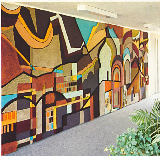
Design: Heini Seger Reine Schurwolle (Wollsiegel-Qualität), handgeknüpft / Pure laine vierge (qualité Woolmark), tufté main / Pure new wool (Woolmark quality), Hand-tufted / Pura lana vergine (qualità sigillo lana), tufting a mano. (Hauptschule, Thüringen/A)