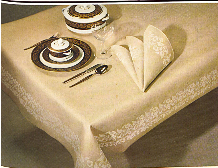
Damask tablecloth in pastel shades with matching pure linen serviettes / Pastellfarbiges Damast-Tischtuch mit passender Serviette aus Reingleinen / Nappe damassée en pur fil, couleur pastel, avec serviette assortie / Tovaglia di damasco a colore pastello, con tovagliolo assortito, di puro lino.