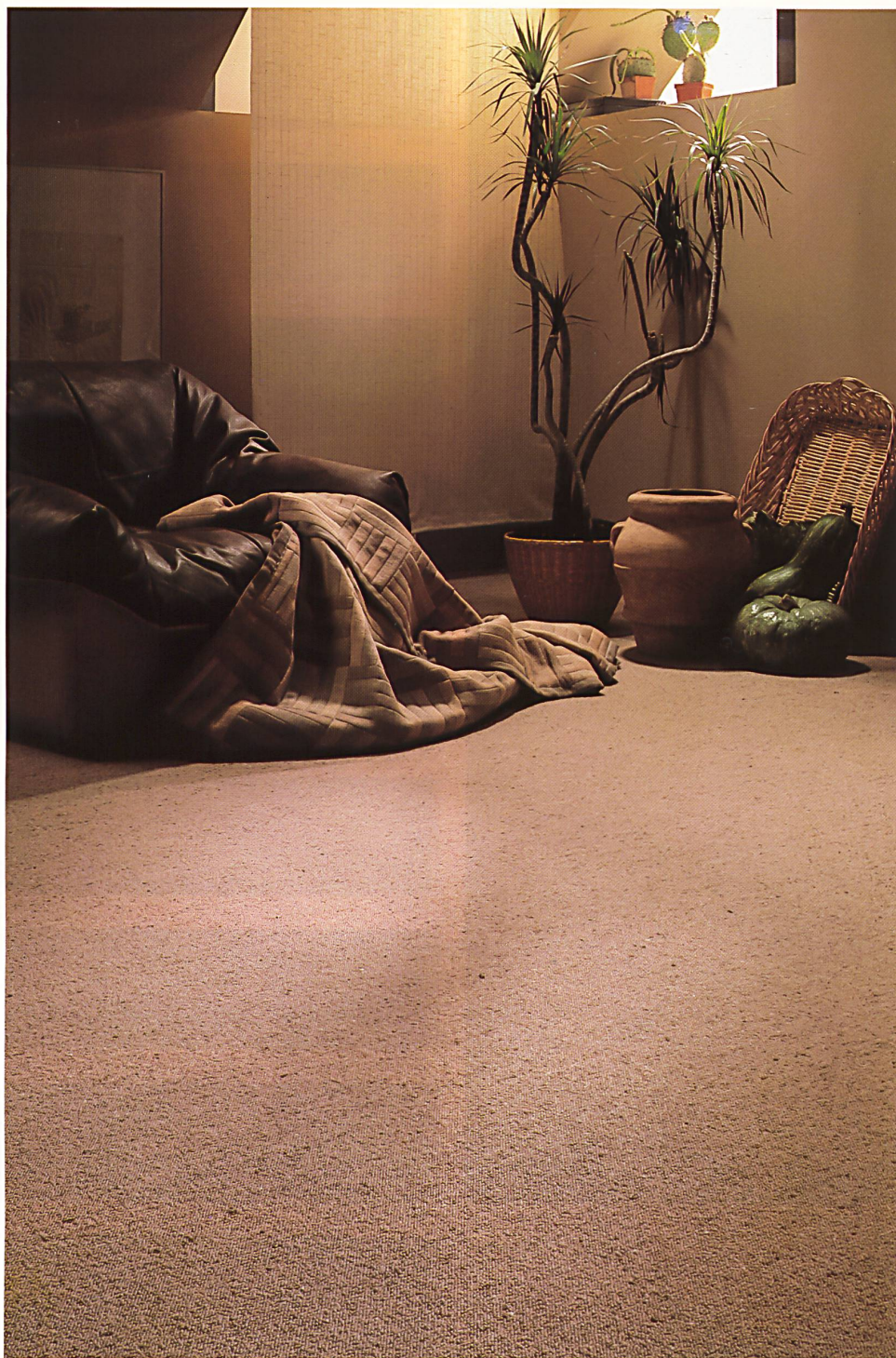
Berber-Schlingenteppich «Cresta», Divandecke «Amara», Dekostoff «Scala».