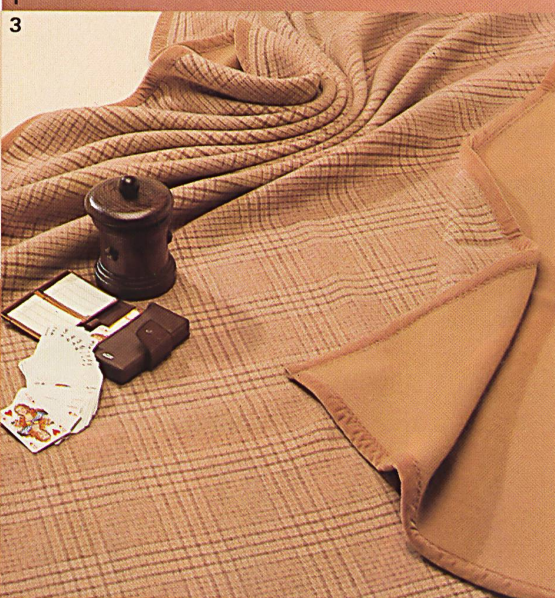
1-3 «Supra», 30% Kaschmir/70% Merino.