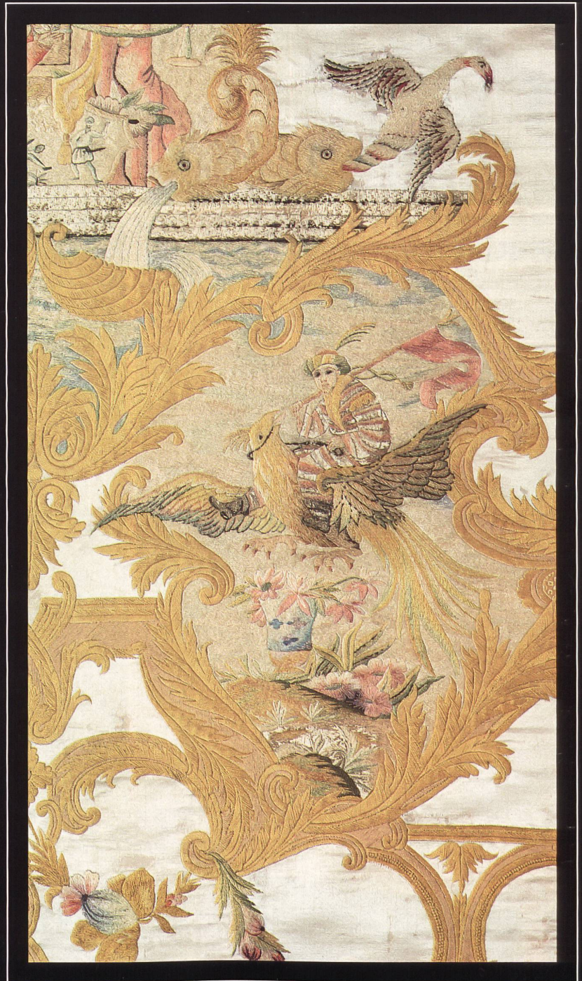
Bunte Woll- und Seidenstickerei auf weissem Satingrund für ein Prunkbett des frühen 18. Jahrhunderts. Die Vorlagen zu den reichen Stickereien entstammen ornamentalen Vorlageblättern jener Zeit. Piemont oder Savoyen um 1720.

In der europäischen Vorstellungswelt nahm China durch alle Zeiten hindurch eine besondere Stellung ein. Märchenhafter orientalischer Reichtum, ungeahnte Vollkommenheit und exotisches Raffinement galten als implizite Charakteristika fernöstlicher Lebensform und wurden zum Atlantis westlicher Sehnsucht. Von Alexander dem Grossen bis zu Napoleon versuchten ehrgeizige Welteroberer das Reich der Mitte zu erreichen. Die phantastischen Reiseberichte eines Marco Polo und die bewusste Fremdenfeindlichkeit Chinas beflügelten weiter Einbildungskraft und Wunschvorstellung. Realistische Berichte von Handelsreisenden, die aus jenen Ländern zurückkamen, zählten kaum – Europa wollte seine Utopie und erfüllte sich diese in fernöstlich interpretierter Kultur und Kunst. Vor solchem Hintergrund muss die Chinoiserie, jene sich über Jahrhunderte hinziehende, kaum zu definierende Stilrichtung, gesehen werden. Chinoiserien haben mit China nur dessen Einfluss gemeinsam, ihr Entstehungsort ist Europa. Sie sind Kopien und besonders während deren Hochblüte im Rokoko amüsante und ästhetizistische Übertreibungen chinesischer Kunstrichtungen. Die Vorliebe Europas im 17. bis 19. Jahrhundert für den Goût Chinois gewährte