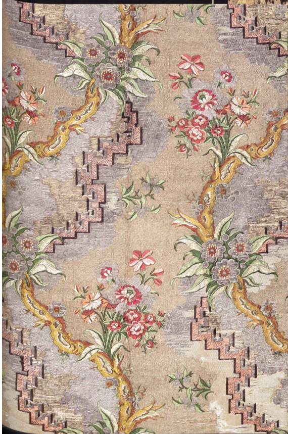
Geschweifte Äste tragen abwechslungsweise Gebinde indianischer und natürlicher Blumen. Rechtwinklig gebrochene Zickzackbänder unterstreichen die Wellenbewegung der Ranken. Seidenstickerei auf gold- und silberbrošiertem Fond. Frankreich oder Norditalien um 1750.

jenem in seiner ornamentalen Form auch dort Zugang, wo er im chinesischen Leben keinen Raum fand: bei Möbeln, Goldschmiedearbeiten, Bronzen, Glaswaren, Tapissereien. Hier überflügelte der Okzident den Orient in prunkvoller Ausführung. Textilien, insbesondere Seidengewebe, waren geradezu prädestiniert, in chinesischer Art dessiniert zu werden. Phönix, Drache und andere fabelhafte Tier- und Pflanzenmuster erlebten in europäischen, vor allem französischen Seidenwebereien eine ungeahnt phantasievolle Neuinterpretation.