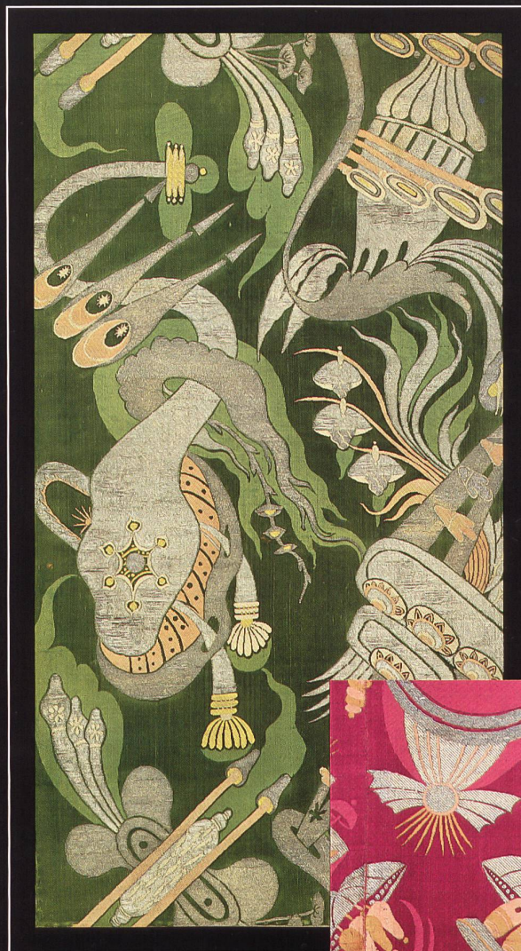
Prunkvolle Seidenbahn «bizarren» Stils. Damast (Atlasbindung und Gros de Tours), broschiert. Lyon oder Venedig um 1700.