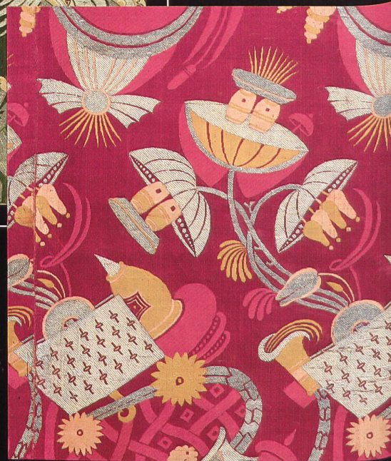
Seidenstoff mit «bizarrem» Dessin. Damast (fünfbündiger Atlas), broschiert. Frankreich um 1705.