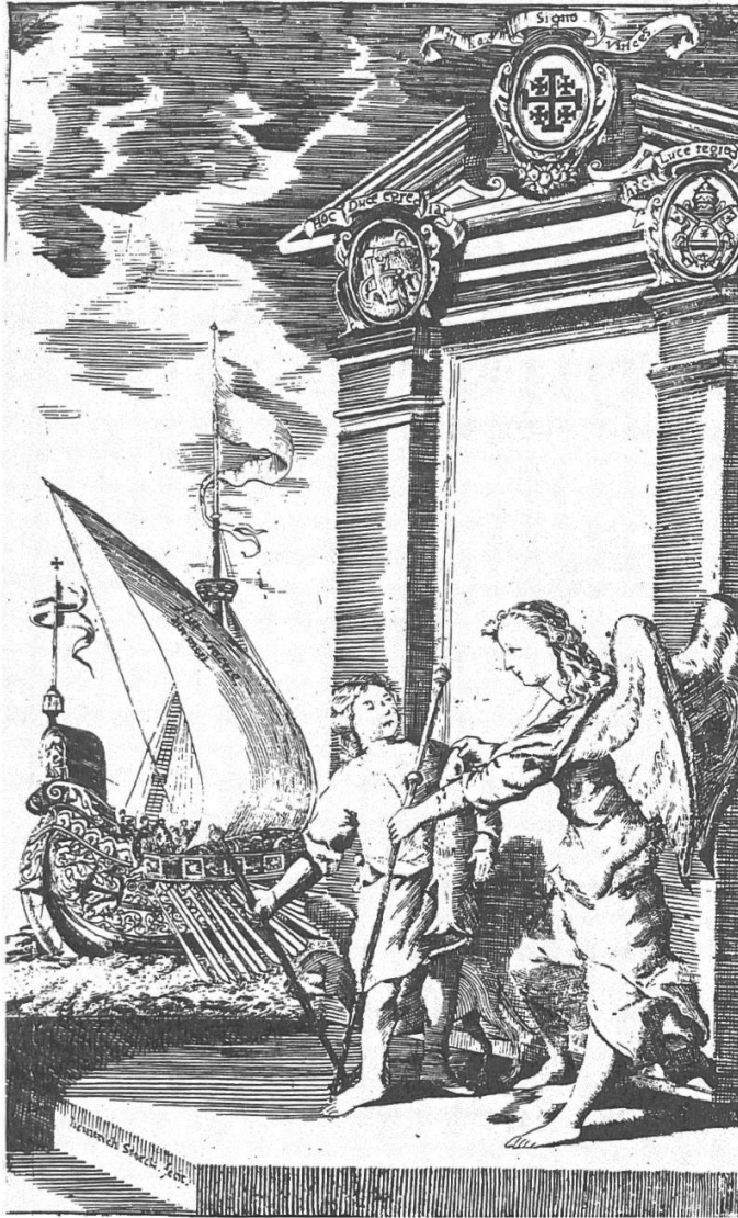
Kupferstich aus dem Pilgerbericht 1702/03 (vgl. gedruckte Quellen, unten S. 122)

festzustellen, dass es sich 1702 um eine gemeinsame Wallfahrt handelt, Brögli jedoch 1792 als Einzelgänger unterwegs ist. Er ist zwar froh, auf der Hinreise, dann während einigen Wochen in Palästina und zu Beginn seiner abenteuerlichen Rückreise, im Franziskanerpater Santi einen «Reisegespan» zu haben, doch seine Entscheidungen trifft er immer allein.