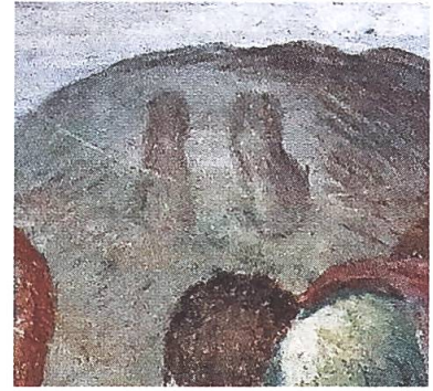
Muri, Klosterkirche. Oktogon, südwestliche Nische. Kleinbild in der Gurte: Himmelfahrt Christi.

Seine letzten irdischen Fuss- abdrücke (Bild oben) wurden seit dem späten Mittelalter von Künstlern immer wieder dargestellt (z.B. Giotto in Padua oder von einem unbe- kannten Meister in Nossa Donna, Savognin).