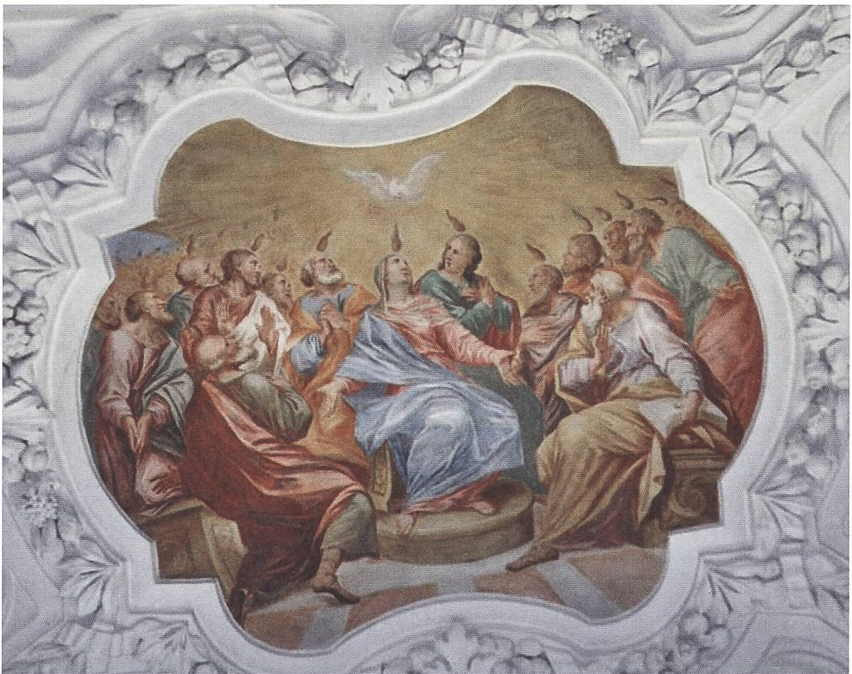
Pfäfers, Klosterkirche. Fresko Pfingsten.