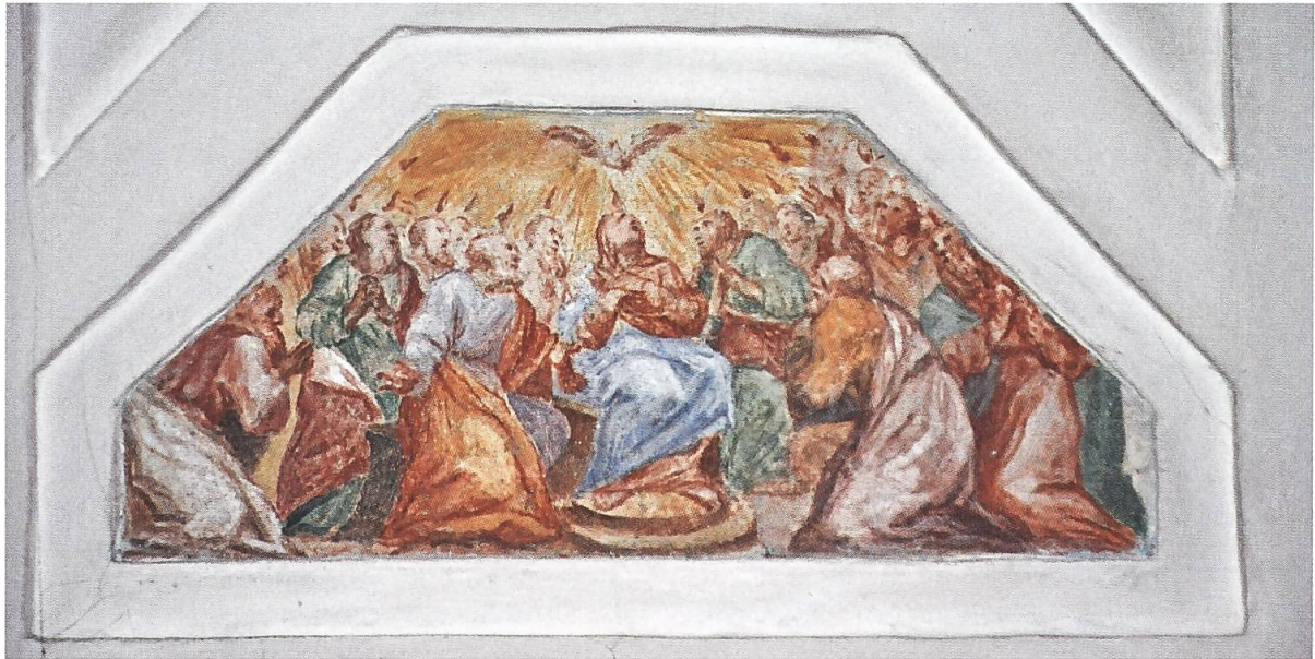
Muri, Klosterkirche. Oktagon, südwestliche Nische, Bogengurte. Pfingsten.

Die Darstellung von Pfingsten im Murianer Kleinbild zeigt grosse Ähnlichkeit mit Fresken in Pfäfers (1693/94) oder in Säkingen (1699/1701).