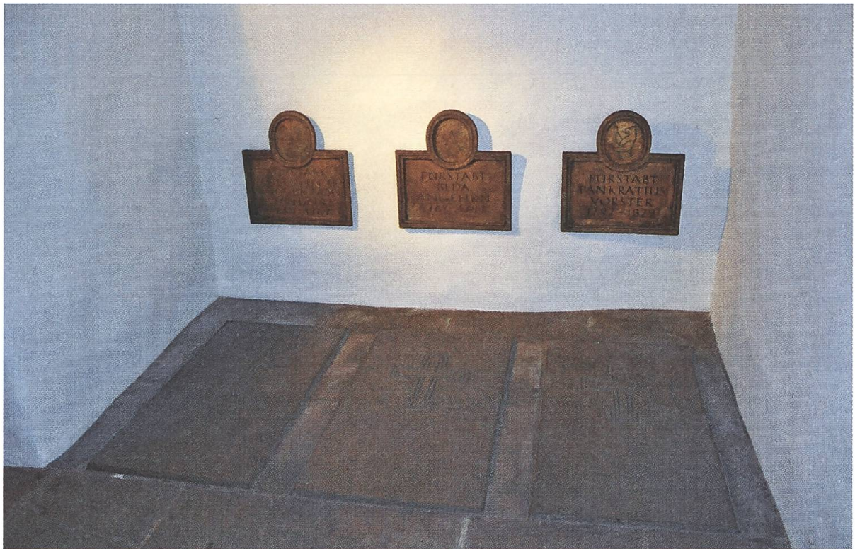
Grab von Fürstabt Pankratius Vorster in der Kathedrale St. Gallen, in der Ostkrypta neben seinen Vorgängern, den Fürstäbten Coelestin II. Gugger von Staudach (links) und Beda Angehrn (Mitte). Foto: https://commons.wikimedia.org/wiki/File:St_Gallen_Stiftskirche_Ostkrypta_Gräber.jpg .

Das Grab von Fürstabt Pankratius Vorster befindet sich heute in der Ostkrypta, auf der Nordseite, zusammen mit den Gräbern seiner Vorgänger, Cölestin Gugger von Staudach (1740–1767) und Beda Angehrn (1767–1796). 33