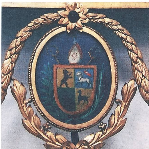
Wappen der Fürstabtei St. Gallen. Unten heraldisch rechts: Bär der Familie Vorster. Detail an der Gedenktafel.

Zu den ersten Gratulanten nach der Wahl gehörte auch Fürstabt Pankratius Vorster, der gleichzeitig seinen Wunsch nach Exil im Kloster Muri wiederholte.