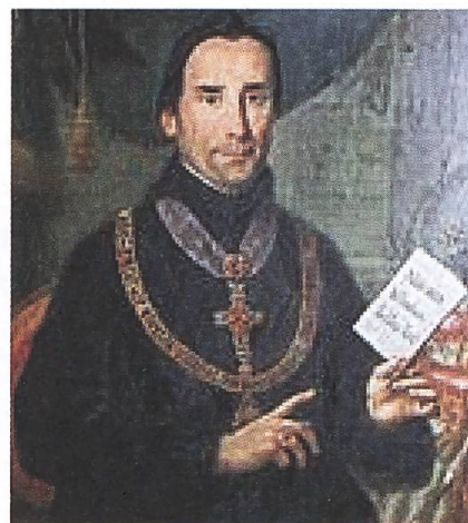
Fürstabt Pankratius Vorster.

Pankratius traf das Stift damals in einem mehr oder weniger verwahrlosten Zustand an. 2 Zudem geriet die Fürstabtei in der Helvetik unter zunehmenden Druck, Herrschaftsrechte an das Volk abzutreten. Schon Abt Beda trat bereits 1795 feudale Rechte ab (was zum Zerwürfnis mit einem Teil des Konventes führte). Die ganze Regierungszeit Pankratius Vorsters stand unter dem Existenzkampf der Fürstabtei St. Gallen. Einen Grossteil der Zeit lebte er deshalb im Exil in Ebringen,