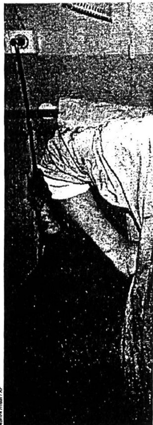
Sarajevo. Blessée dans le

En Bosnie. Les forces bosniaques, à majorité musulmane, ont repris hier leurs bombardements contre les positions serbes dans le secteur de Doboj, une ville de plus de 100 000 habitants située dans le nord de la Bosnie. En Bosnie du Sud, 1 037 Musulmans détenus dans les camps de Rodoc et Gabela ont été libérés par les forces croates bosniaques entre le 14 et le 17 décembre sous les auspices du Comité international de la Croix-Rouge (CICR), et vingt-deux enfants ont été évacués de la partie musulmane de Mostar assiégée en direction de Split, sur la côte Adriatique. S.Eir. avec AFP