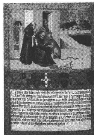
Giovanni di Paolo, “San Girolamo medica la zampa del Icone”.

Sin qui la descrizione, fedele, del disegno, in cui appaiono chiaramente i simboli dell'aureola, che emana santità anche sull'animale e quello della selva, luogo del peccato; e sul quesito del monaco, alieno al dipinto, nasce la fantasia visionaria che dà vita all'intreccio strutturato sul timbro stilistico del flusso di coscienza, lo stream of consciousness , a cui non è aliena la lezione di Virginia Woolf 36 . La narratrice si sostituisce a San Girolamo nel donare aiuto al leone, il quale si presta alle cure ponendo la sua zampa, «un peso enorme, il carico d'una sovrumana condiscendenza» 37 , sulle ginocchia della donna che estrae la spina e fascia la zampa con il proprio fazzoletto. Questo gesto crea una compartecipazione tra i due esseri, che sembrano così ritrovare un'armonia perduta. Tuttavia il culmine del racconto si raggiunge quando la donna, incredula di quanto accaduto e convinta d'aver vissuto un momento onirico, vede ai suoi piedi il «fazzoletto, che, ancora annodato, conserva l'impronta della sua zampa, con al centro una piccola macchia di sangue» 38 . Associando questa immagine alla simbologia cristiana del leone derivata dai Bestiari medievali, e in primis in riferimento alle tre nature descritte nel Fisiologo , sembra quindi evidente riconoscere nel fazzoletto una trasposizione della sacra sindone.