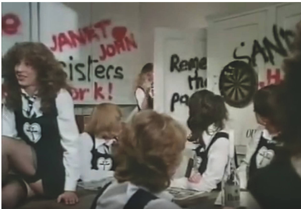
Fig. 4 : Une des chambres d'élèves dans The Wildcats of St Trinian's (1980).

Cet aspect est également sensible dans if.... , le film de Lindsay Anderson qui obtint la Palme d'or au Grand prix international du Festival de Cannes en 1969 13 . Il offre une version plus sérieuse, plus lyrique et plus dramatique que la série des St Trinian's, mais présente également au spectateur les chambres des principaux protagonistes : les murs de celle de Mick Travis – interprété par Malcolm McDowell – sont décorés de photos découpées dans des magazines, montrant des armes de guerre, des tueries en Afrique et des soldats au Viêt-Nam, la photo de Robert Capa montrant des cadavres sur les plages du débarquement en Normandie, mais aussi la photo de Lénine, du Che et du Pape ; celle de Johnny, interprété par David Wood, est plus chaudement colorée que celle de Mick et ornée de photos de filles nues et de pin-up, de toréadors et de joueurs de rugby. Ces décorations symbolisent la révolte de la jeunesse contre le monde construit par les adultes et leurs politiques absurdes ; la vie contre la mort symbolisée par l'étude. Anderson n'a cependant pas voulu faire un film sur des jeunes gens austères et toujours en colère des années soixante. Il a voulu rendre aussi certains plaisirs du temps de l'école et montrer la vie à cet âge-là. À l'opposé de ces chambres, celles des Whips – les plus grands parmi les élèves, chargés de la discipline auprès des plus jeunes – et des Seniors illustrent le respect et l'admiration qu'ils