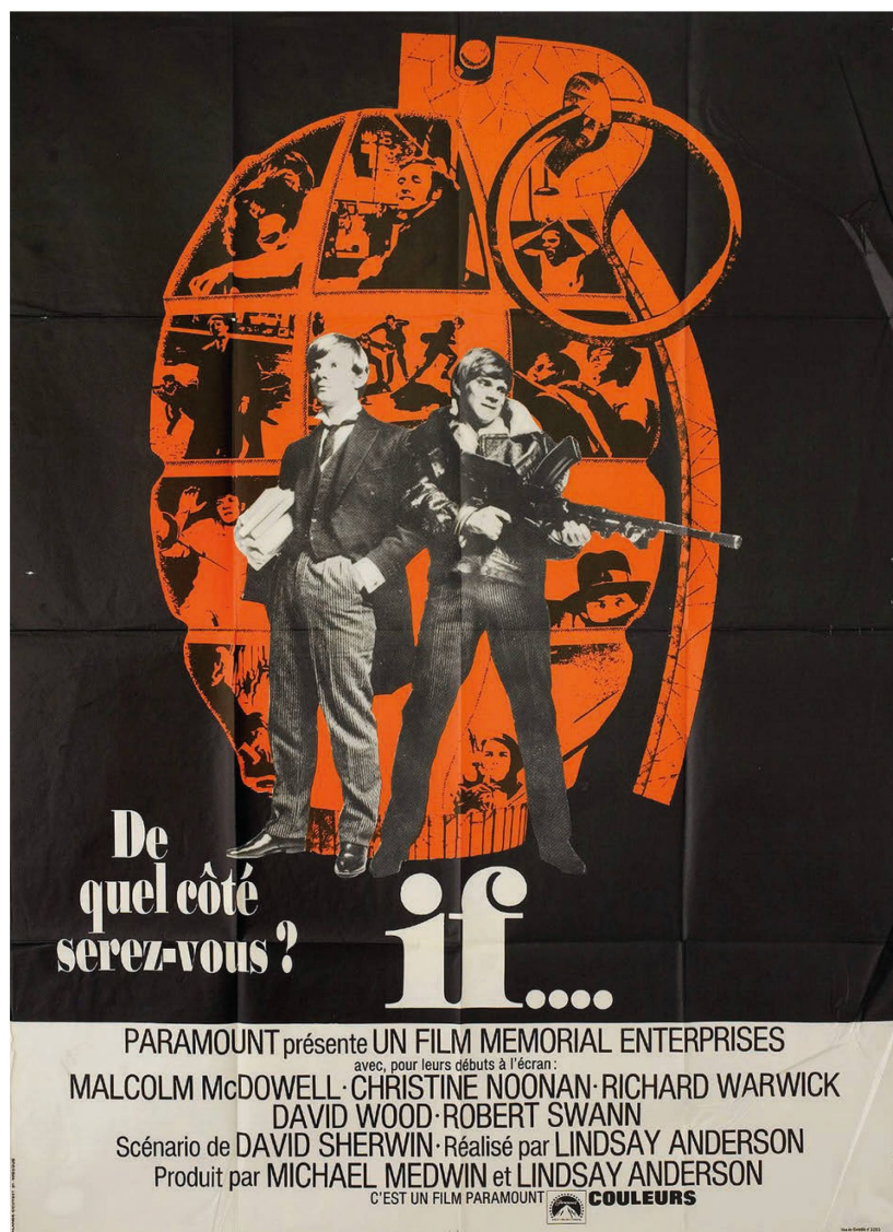
Fig. 5 : Affiche française de if... , de Lindsay Anderson (1969).

La scène finale du film où les « Croisés » 15 , dont fait partie la jeune fille, ouvrent le feu au fusil-mitrailleur sur les parents, les professeurs et les autorités invitées à la fête de l'école, constitue le degré ultime de l'indocilité et de l'insoumission. Celle-ci est nécessaire contre le monde de l'imposture, du mensonge, de l'hypocrisie et des valeurs absurdes établies depuis longtemps par les adultes, les citoyens, les raisonnables et les habiles. Contre la société polie où les concessions sont de mises 16 . C'est de la jeunesse, des