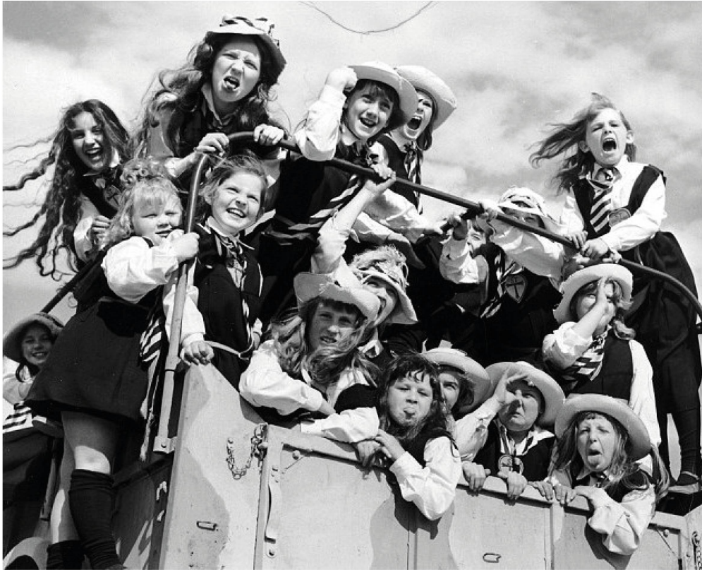
Fig. 3 : The Pure Hell of St Trinian's (1960).

Les élèves de St Trinian's, tout comme les enfants de La Guerre des boutons ou de La Foire aux cancre s, ont leur monde à elles. Les chambrées où elles vivent sont décorées de graffitis et de slogans : elles boivent du gin ou font venir, quand elles sont parmi les grandes, les jeunes chevelus guitaristes de l'époque qui animent les soirées où elles dansent en baby doll et petites culottes. Roorda se désolait de l'intrusion toujours plus forte de l'État dans la vie des individus et regrettait que les égoïstes perdent le droit d'aller penser dans leurs coins bien à eux (Roorda 1970 : 27). Il aurait vu qu'à St Trinian's, aucune autorité ne s'aventure. Les internats permettent paradoxalement de montrer au cinéma la création de ces lieux propres, que les élèves arrangent selon leurs goûts et personnalité.