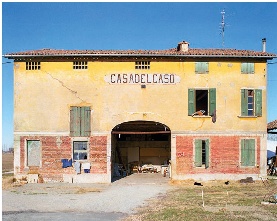
Fig. 5: Olivo Barbieri, Emilia Romagna, 1980.

Werner Herzog sosteneva che le storie nascono dai paesaggi.