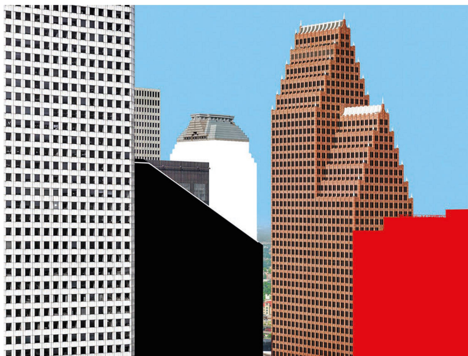
Fig. 7: Olivo Barbieri, site specific_HOUSTON 12 , 2012.

O. B.: site specific_ è un progetto globale che ridefinisce la forma della città contemporanea. Le immagini del progetto site specific_ , iniziato nel 2003, sono tutte realizzate dall'elicottero. Ho sorvolato più di cinquanta città, metropoli e megalopoli. Adottare una postazione flottante ha limitato il rischio di visioni obbligate e prevedibili. Dopo l'undici di settembre e la distruzione delle torri gemelle mi sono chiesto che valore reale hanno oggetti architettonici identitari come il Colosseo, la torre di Pisa, il Tower Bridge, Time Square ecc. Se sparissero, come muterebbe la condivisa percezione psicogeografica del mondo? Ho tentato di rileggere la città contemporanea come fosse un plastico in scala, una installazione temporanea, e da un punto di vista scollegato dalle parole, dai suoni, dagli odori. Immagini e parole possono essere separate, a volte dovrebbero esserlo. Le fotografie sono una messa in codice dell'immagine del reale , le parole sono una messa in codice dello scheletro dei pensieri.