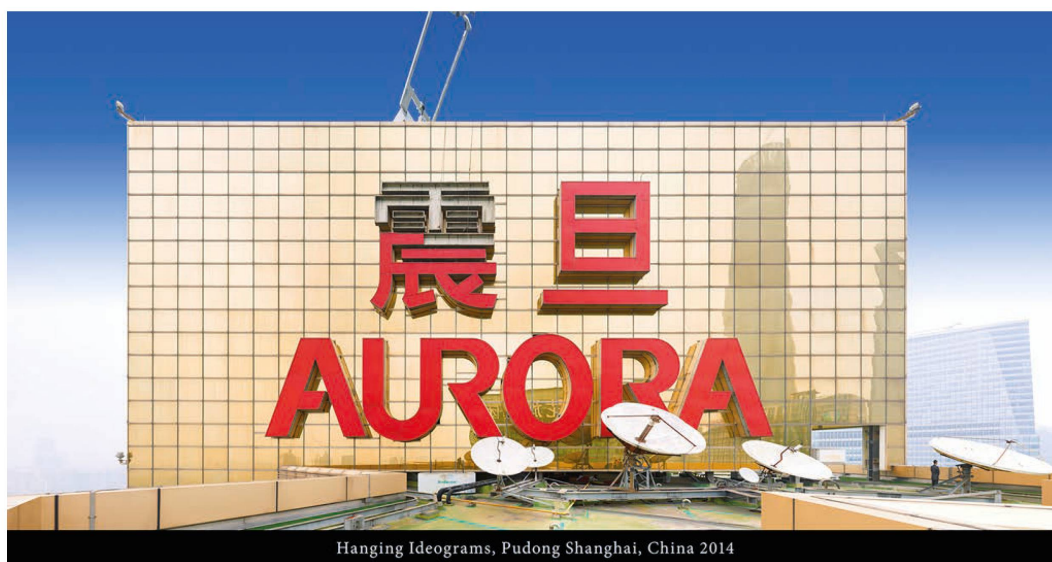
Fig. 6: Olivo Barbieri, Shanghai, Cina, 2014.

Si ha più a che spartire con gli interrogativi sollevati dalla teoria dei quanti che con le vecchie regole della prospettiva. Dobbiamo entrare in un altro mondo, siamo ormai in un mondo nuovo. Un punto di vista solo non esiste più. Qualcuno o qualcosa che riprende un'immagine da un punto di vista senza esserci, e la costruisce, la definisce da un altro punto di vista, è una possibilità molto interessante di cui bisogna fare tesoro. Nella nostra quotidianità siamo immersi nelle immagini e da quanto reso possibile dal calcolo quantistico. Non sappiamo nulla delle immagini e nulla dei quanti. Li vediamo soltanto funzionare.