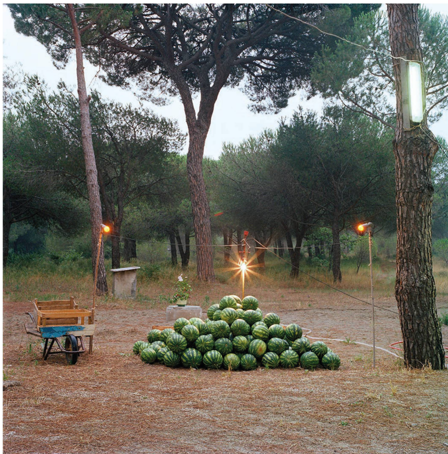
Fig. 1: Olivo Barbieri, Follonica, Grosseto, 1983.

V. T.: Ricordo un'intervista in cui lei cita Burroughs e richiama Flaubert, osservando come si tratti di un autore che i fotografi hanno poco considerato. Come descriverebbe la parabola del suo rapporto da fotografo con la parola e con la scrittura? Come è evoluto questo rapporto?