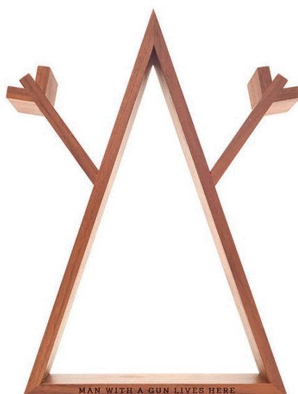
Fig. 4: Olivo Barbieri, Man With A Gun Lives Here, 2018.

V. T.: Ne L'impero dei segni Barthes percorre lo spazio giapponese come se fosse un grande testo; costruendo un'ambivalenza tra i segni europei e i segni orientali, anche rispetto al modo di leggere e orientarsi nello spazio. Il suo scatto del 1980 Casa del caso attesta il riconoscimento nella realtà di forme di testualità; un aspetto che fa parte anche della storia della fotografia, pensando a Walker Evans o Ralph Steiner. C'è per lei una testualità della realtà verso cui il fotografo deve "solo" essere ricettivo, piuttosto che costruirla?