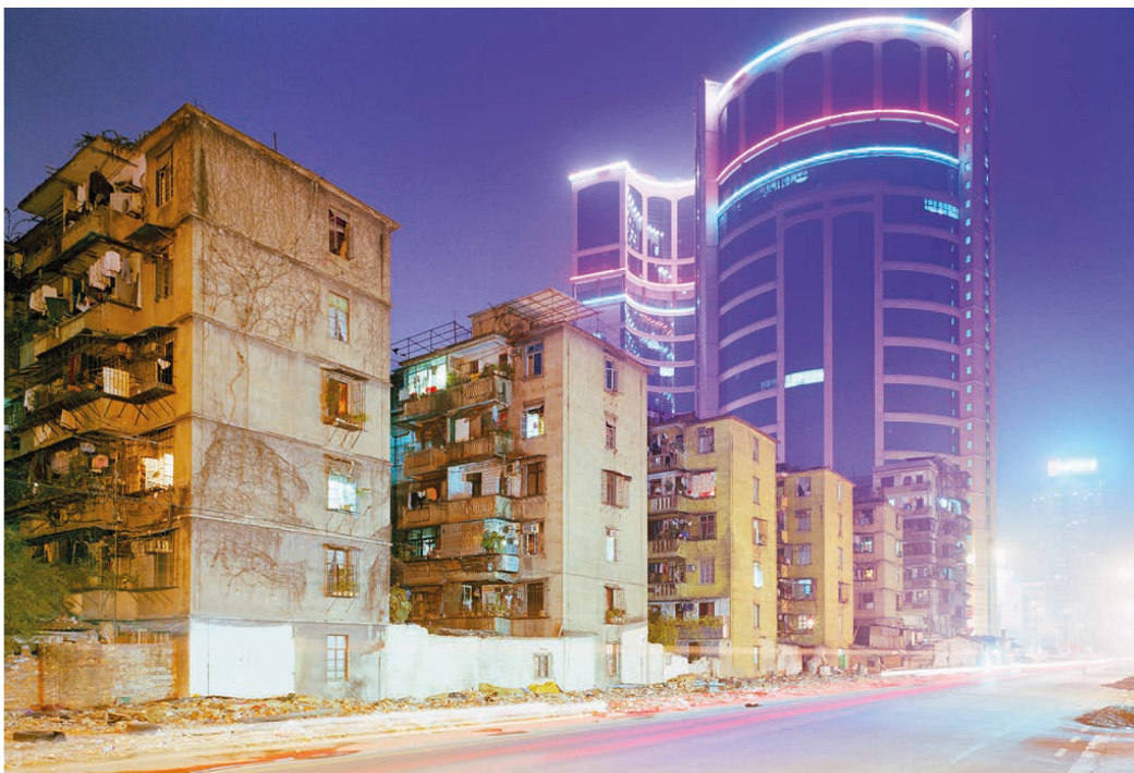
Fig. 3: Olivo Barbieri, Canton, Cina, 1998.

V. T.: La sua insistenza sull'importanza di parlare di immagini e non di fotografie si lega alla presenza, nelle sue opere, di un'interrogazione sui confini tra realtà e rappresentazione, verità e finzione?