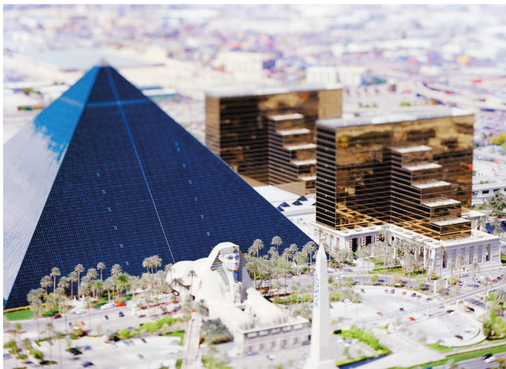
Fig. 2: Olivo Barbieri, site specific_LAS VEGAS 05, 2005.

mostrano che per capire la Cina contemporanea devi conoscere Las Vegas». A seguito di questa riflessione nel 2017 ho realizzato American Monument and Monument , mettendo in relazione icone culturali e vernacolari. Le monumentali insegne delle ciambelle Donut e i dipinti di Mark Rothko. Da allora, spontaneamente, ho iniziato a decifrare aree del mondo come fossero parchi tematici, le grandi cascate, le grandi montagne, l'architettura cinese, le mille sfaccettature del web, le grandi discariche del sud est asiatico, i codici identitari.