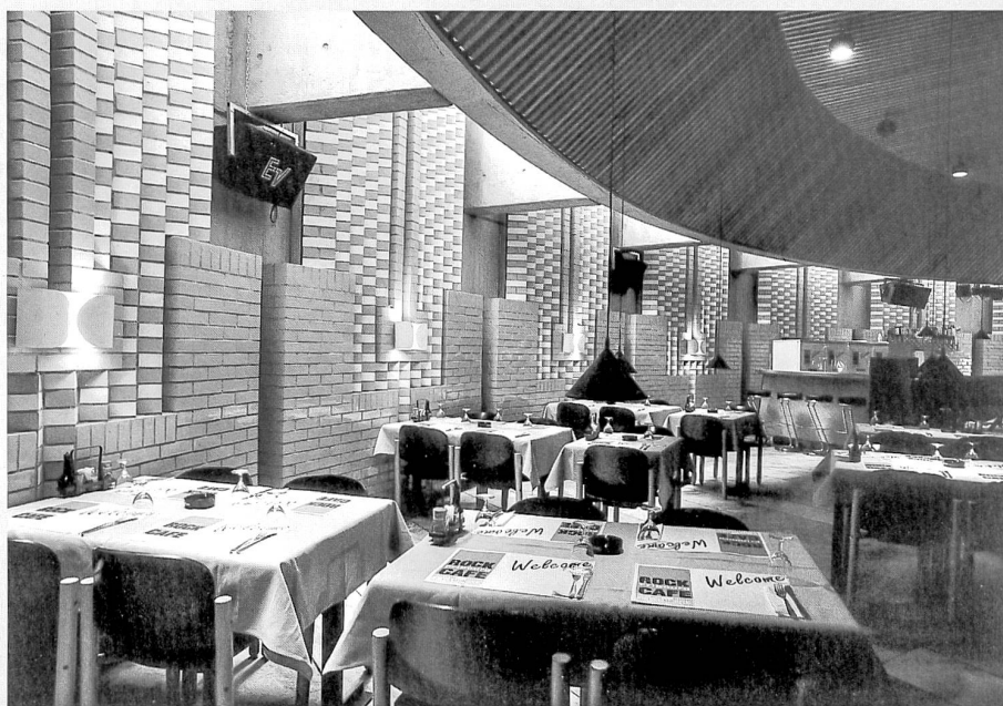
Le restaurant «Le Gambrinus» (actuellement «Rock Café»)

La banque a achevé sa mue en changeant d'enseigne. Ne dites plus «Banque de l'Etat de Fribourg». Depuis le 10 novembre 1996, l'établissement a récupéré le nom qu'il aurait dû porter dès l'origine: «Banque Cantonale de Fribourg». En 1892, les financiers helvétiques