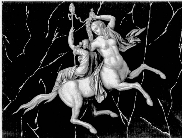
Centauresse et ménade, dessus-de-porte d'après les peintures de la Villa dite de Cicéron à Pompéi, Museo Nazionale de Naples, publiées en 1757 dans les «Antichità di Ercolano»

Pièce emblématique de la maison, le grand salon dont le général Ney était un habitué paraît-il, rompait par sa simplicité avec les grands salons baroques des années 1760. Cette volonté de renouvellement est évidente dans le choix des motifs des quatre dessus-de-porte et de glace, des reproductions 19 de peintures découvertes le 18 janvier 1749 dans la villa dite de Cicéron à Pompéi. Copiées et gravées, elles furent publiées en 1757 dans le premier des huit volumes des «Antichità di Ercolano» (1757-1792), une publication réservée au roi de