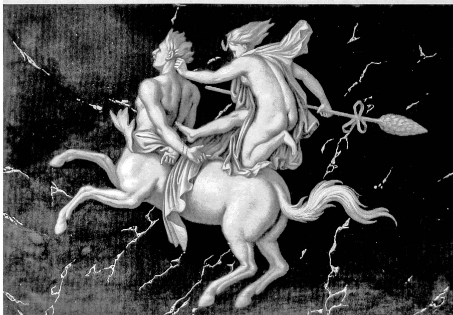
Centaure chevauché par une ménade, dessus-de-porte, grand salon du 1 er étage, années 1780

Naples qui en fit cadeau à divers privilégiés. Un centaure et une «centauresse» furent à nouveau publiés en 1779 dans la cinquième livraison du premier volume du «Voyage pittoresque» de l'abbé de Saint-Non 20 , gravés d'après un dessin de l'architecte Pierre-Adrien Pâris. Le motif du centaure chevauché par une ménade fut si prisé qu'il figurait au catalogue de la manufacture de Joseph Beunat à Sarrebourg en 1819 comme ornement d'architecture proposé en «carton-pierre» 21 . La série complète de Fribourg copie manifestement