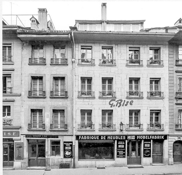
Grand-Rue 12A-12B, photographiés par Jacques Thévoz au début des années 1960 pour le volume non publié de Marcel Strub

Ces pièces rares sont liées à la fonction du bâtiment, qui servait de pharmacie depuis le début du XIX e siècle. Il est probable qu'elles appartenaient au pharmacien Jean Jacques Muller, qui acheta en mars 1782 la maison Grand-Rue 15 et y ouvrit en septembre une pharmacie à l'enseigne du Cerf 10 . Vingt ans plus tard, le 7 septembre 1802, il échangea