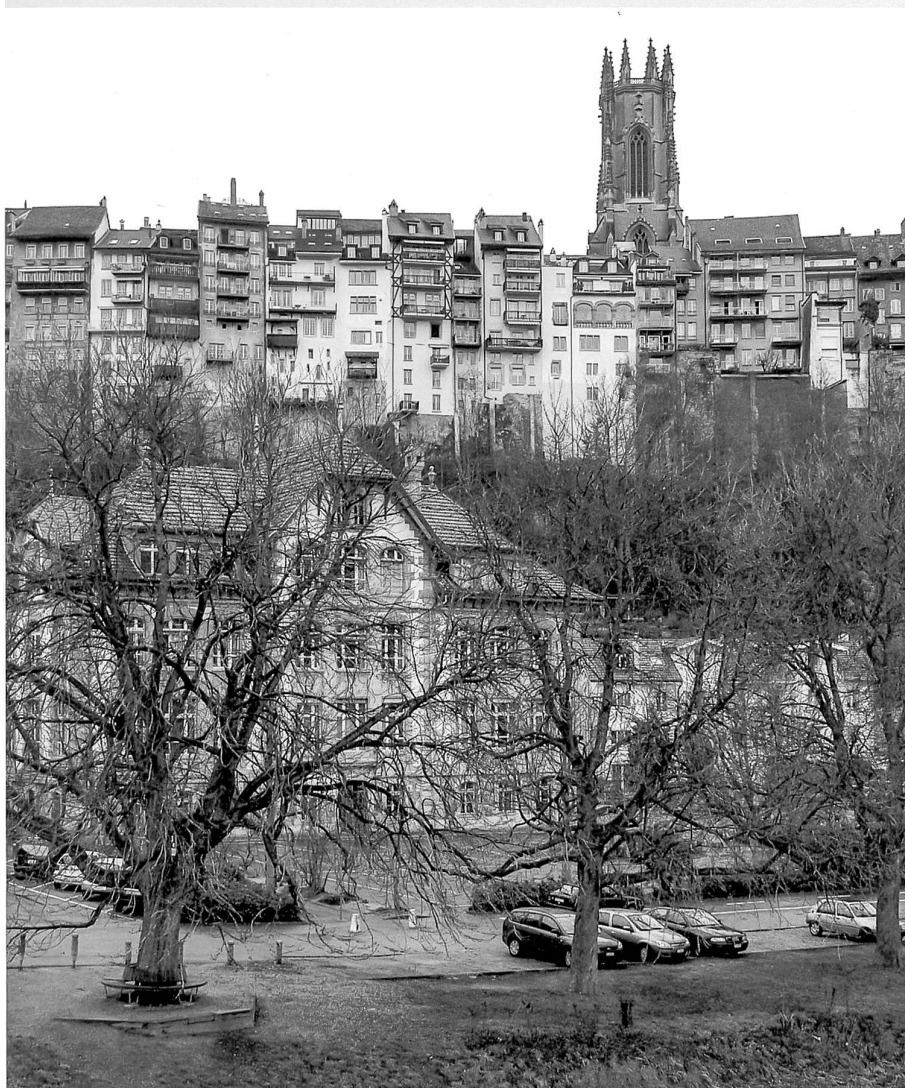
La maison, dans le fondu enchaîné du Bourg et la «merveilleuse souplesse de cette longue échine, qui juxtapose les toitures étroites comme les pièces d'un domino» (Hermann Schöpfer)

18 AEF, Af 205, CI 1882-1900, Af 207, CI 1916-1934; Annuaire de la ville de Fribourg 1894, 1898, 1900, 1901, 1903, 1907, 1913; Maxime BRUNISHOLZ, La Fédération ouvrière fribourgeoise 1906-1931, Fribourg 1931, 14; Michel MILLASSON, Le mouvement chrétien-social dans le canton de Fribourg, de 1920 à 1936, mémoire de licence de l'Université de Fribourg, typoscript 1969, 22-25.