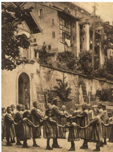
LA FAÇADE ARRIÈRE EN PANS DE BOIS ET SES LATRINES, DANS LE 1 er QUART DU XX e SIÈCLE

Sur la façade pignon, le rez-de-chaussée et le premier étage furent dotés de baies géminées aujourd'hui murées. Leurs encadrements de molasse furent taillés au ciseau et au réparoir, avec tablettes saillantes, bûchées à la fin du XVII e s. Au rez-de-chaussée, la mouluration combine une battue et un double cavet amorti par un congé en pelle sur les piédroits, oblique sur le meneau.