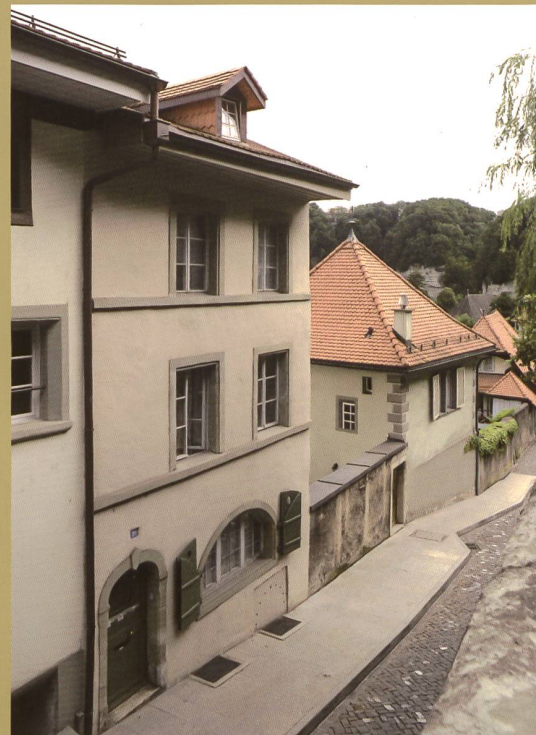
LA FAÇADE SUR RUE, RECONSTRUITE FIN XVII e S.

Au XIV e siècle, la construction initiale fut surélevée de 4 m 50 avec une maçonnerie de galets et de boulets complétée, surtout dans les parties hautes, par quelques moellons de molasse taillés à la laye brettelée, outil en usage à l'époque. Le bâtiment comportait alors trois niveaux au-dessus d'une cave aménagée dans la pente comme aujourd'hui, mais les niveaux étaient décalés d'un mètre vers le bas. Dans une phase ultérieure, le parement du rez-de-chaussée fut repris avec un appareil régulier de moellons de molasse où se lisent encore quelques marques de hauteur d'assises comme on le faisait aux XIV e et XV e siècles à Fribourg. Vu la chronologie des interventions, on situera ce chantier plutôt au XV e siècle 3 . La partie arrière fut entièrement reconstruite au siècle suivant. La maison avait alors ses dimensions actuelles, une largeur moyenne de 6 m pour une profondeur de 10 m dans l'œuvre, plus