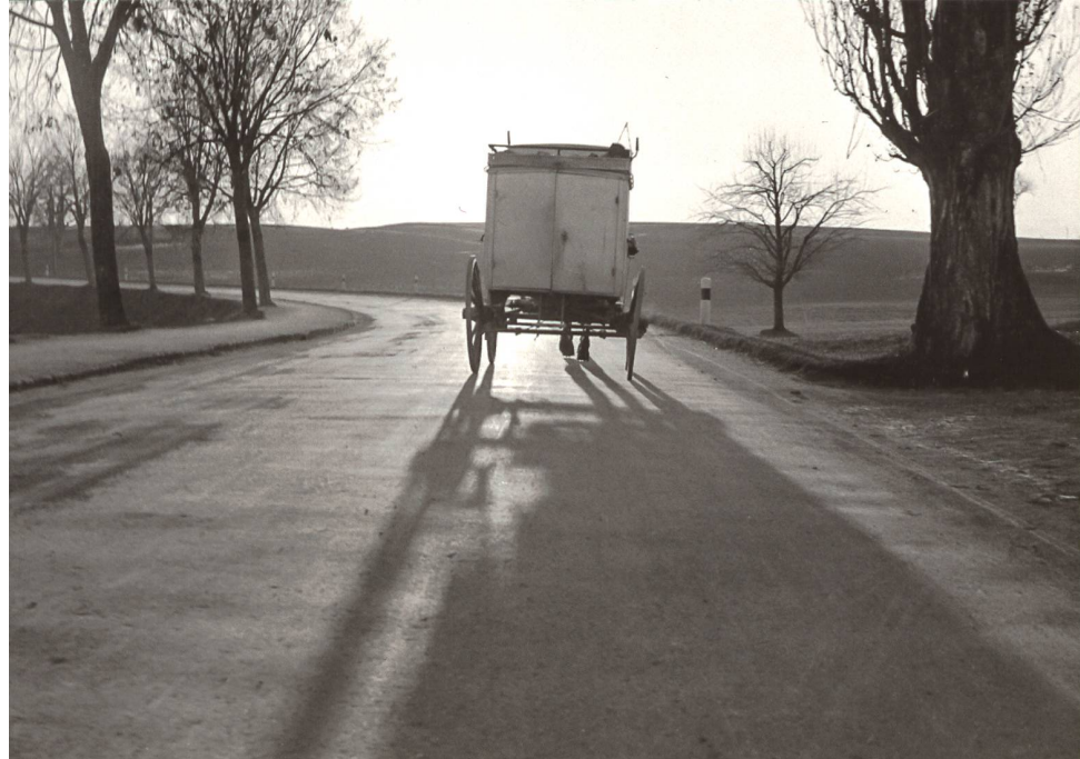
LE LIVREUR DE GLACE, AU PETIT MATIN, VU PAR JACQUES THÉVOZ (BCUF, FONDS JACQUES THÉVOZ)