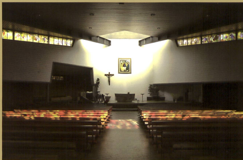
LA CHAPELLE DE SEMAINE OUVERTE SUR LA NEF AVEC LES ŒUVRES DE YOKI, DALLES DE VERRE (1965), CHEMIN DE CROIX PEINT (1973) ET VERRIÈRES ABSTRAITES (1992)

MIS À PART SON EMMARCHEMENT DE BASALTINE ET SON CHEVET BAIGNÉ DE LUMIÈRE, LE CHŒUR SE FOND DANS L'ESPACE DE LA NEF. LES TRADITIONNELS BAS-CÔTÉS ONT DISPARU PERMETTANT L'AMÉNAGEMENT DE LA CHAPELLE BAPTISMALE ET DE LA SCÈNE DES CHANTRES D'UN CÔTÉ, DE LA CHAPELLE DE SEMAINE DE L'AUTRE