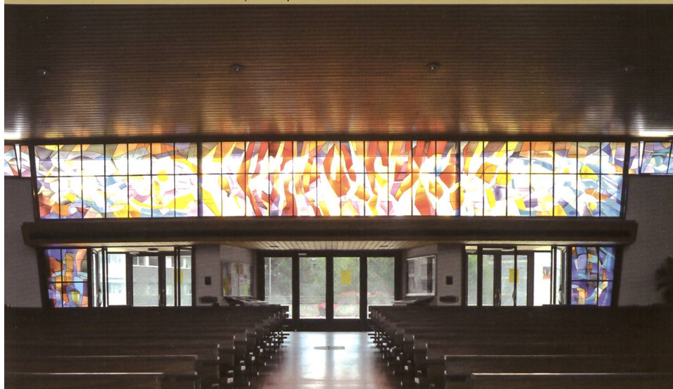
DEPUIS 1992, GRÂCE AU TALENT DE YOKI, LES LANGUES DE FEU DE LA PENTECÔTE FLAMBOIENT SUR L'ENTRÉE

Le sculpteur fribourgeois Antoine Claraz a réalisé l'ensemble du mobilier liturgique: autel pentagonal et fonts baptismaux triangulaires en grès coquillier, lampe de sanctuaire et tabernacle orné d'épis en cristal de roche à l'articulation des chœurs de l'église et de sa chapelle, ambon en basaltine lié à la chaire réduite à une grille en fer forgé aux symboles des Évangélistes. On lui doit aussi la belle Madone de l'oratoire du baptistère, en cuivre repoussé, habillée par les émaux de Liliane Jordan. Ce dépouillement voulu met en valeur l'espace et le Peuple de Dieu qui l'habite à chaque célébration. Au mur du chevet, au lieu d'un grand retable, on s'est contenté d'un Christ en croix du début du XVII e siècle, prêt du Musée d'art et d'histoire. On attendra 1973 pour orner la chapelle de semaine de l'Agneau Pascal en bronze d'Emile Angéloz. Les «murs de lumière»