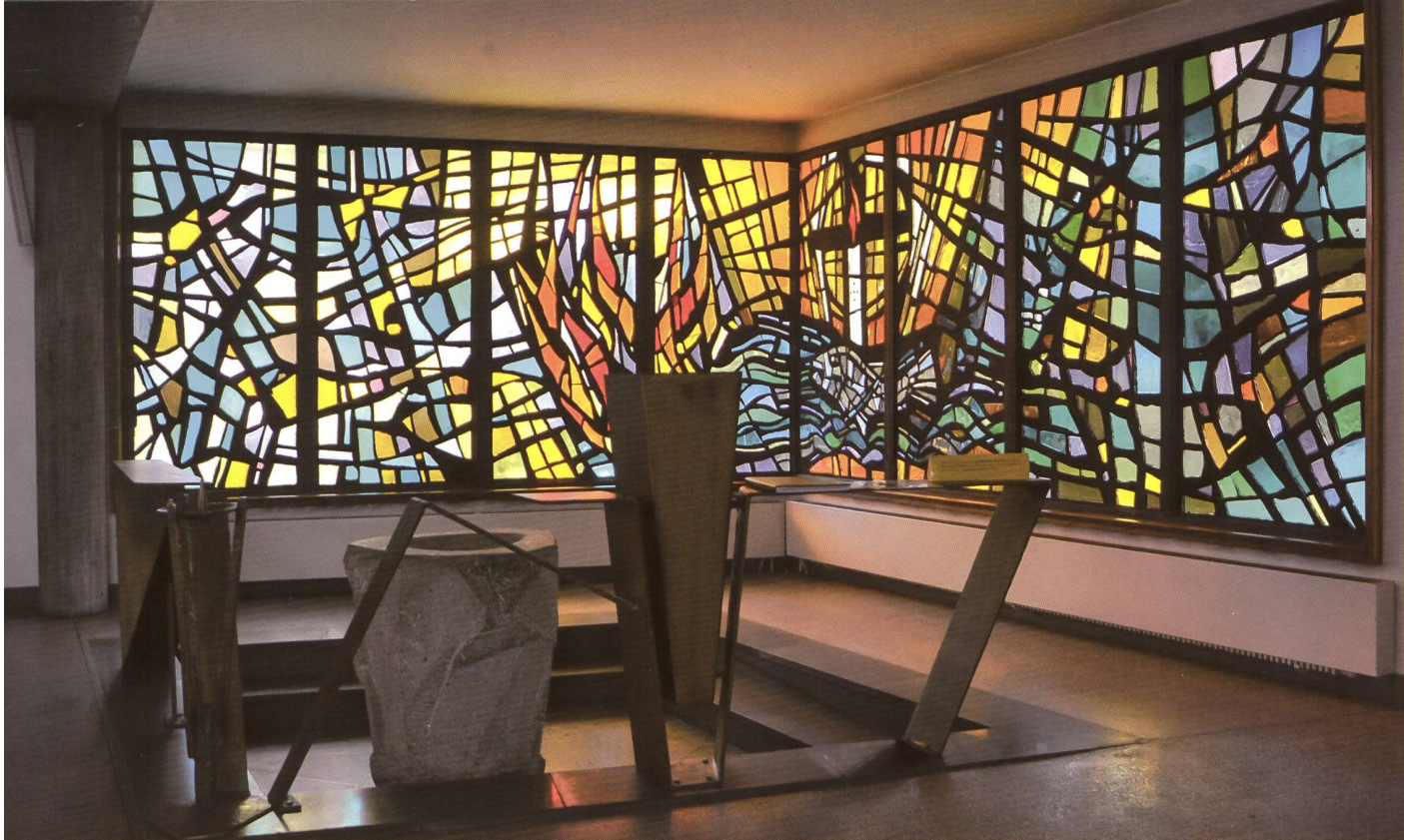
LA CHAPELLE BAPTISMALE AVEC LES FONTS BAPTISMAUX D'ANTOINE CLARAZ, DANS LEUR ÉCRIN DE LUMIÈRE CONÇU PAR YOKI

la réalisation de l'église, vingt-huit ans après le premier coup de pioche.