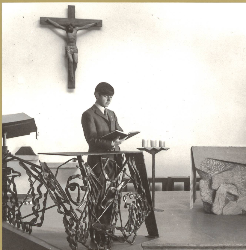
UN LAÏC EN CHAIRE DANS LES ANNÉES 1970 ENTRE L'AMBO ET L'AUTEL DE CÉLÉBRATION, ŒUVRES D'ANTOINE CLARAZ, SOUS L'ŒIL D'UN CHRIST EN CROIX DU DÉBUT DU XVII e SIÈCLE (BCUF, FONDS BENEDIKT RAST)

de la parcelle, cet «arbre œcuménique» 24 , symbole de la nouvelle unité des chrétiens, complète le message prophétique de Sainte-Thérèse. Et si pour certains, le Concile Vatican II a pris de l'âge, ses églises, elles, n'ont pas pris une ride.