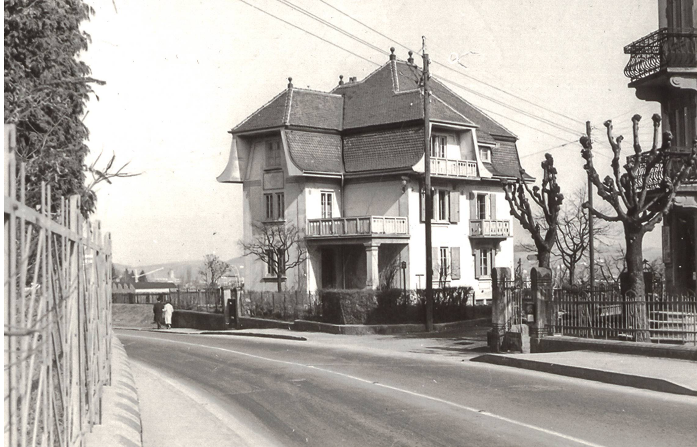
A LA SORTIE DE VILLARS-SUR-GLÂNE ET À L'ENTRÉE DE FRIBOURG, LA VILLA DEMARTA AU DÉBUT DES ANNÉES 1960, AVEC À L'ARRIÈRE-PLAN, LES SHEDS DE LA SOCIÉTÉ DYNA, OÙ FUT PRODUITE DÈS 1958 LA FAMEUSE PÂTE À TARTINER, «LE PARFAIT» DE NOS PETITS-DÉJEUNERS