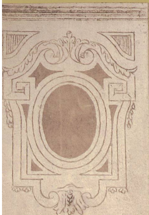
DÉTAILS DU DÉCOR DE SGRAFFITE EN FAÇADE ORIENTALE: UN CARTOUCHE EN GUISE DE CHAPITEAU SUR LES ANGLES, DES TABLES LIANT LES BAIES, DES ENTRELACS ET DES TORES DE LAURIER. ATELIER DEMARTA FRÈRES (?), 1912

D'exécution rapide tout en exigeant de la virtuosité, résistant aux rigueurs du climat, efficace – les motifs étant bien lisibles de loin – ce revêtement mural est en outre bon marché et offre un choix inépuisable de motif adaptés aux moyens ou aux goûts des maîtres d'ouvrage. Les sgraffites de la villa d'Arnold Demarta, probablement réalisés par son entreprise, témoignent d'un savoir-faire qui ne se limitait pas qu'aux fragiles moulages en stuc. Quelle meilleure réclame pour ce nouveau produit que les façades en camaïeu de l'entrepreneur à l'entrée sud de la ville! Pour l'essentiel, le décor de la villa Demarta souligne les articulations architecturales en lieu et place d'éléments traditionnels en stuc: pilastres corniers et chapiteaux, cordons moulurés, frises et corniches, encadrements de baies, panneaux divisant les murs et tables liant les baies. Le répertoire formel est académique: frises de grecques, d'entrelacs et de postes, couronnes et tores de laurier, cartouches. Sous le porche de la maison, une scène bucolique accueille le visiteur. On y voit dans un médaillon un paysan d'âge mur guidant son fils à la charue, dans un paysage préalpin d'où n'émerge que le clocher d'une église. Le motif en tondo est traité comme un tableau dans le tableau. Au premier plan, deux putti, de dos, tenant une faux et un râteau, contemplent la scène tout en ajustant des guirlandes végétales