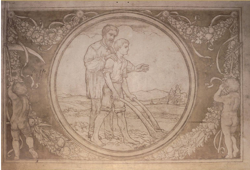
LES LABOURS, SGRAFFITE D'HENRI ROBERT, AVEC GUIRLANDES DE FRUITS ET DE LÉGUMES, 1912

Mis à part la cage d'escalier avec ses carreaux de ciment polychromes et son décor mural, malheureusement recouvert mais dont on devine encore le tracé, les aménagements de la maison Demarta sont restés modestes et tranchent avec le traitement des façades, articulées par un revêtement de sgraffite (ou grattage) unique à Fribourg. La technique consiste à superposer d'épaisses couches d'enduits colorés et de chaux, généralement un mortier de ragréage, puis une couche sombre teintée dans la masse suivie d'une couche plus claire et plus fine, un enduit frais sur lequel on reporte le motif à inciser à l'aide d'un grattoir pour révéler la couche de mortier sous-jacente. Ce type de décor fut développé dès le XV e siècle par les artistes florentins qui couvrirent les façades