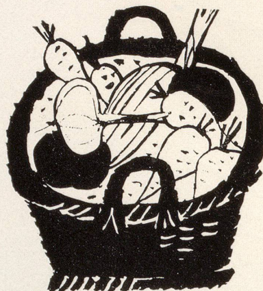
Thomi + Franck AG Basel