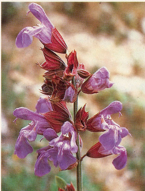
Blühende Salbeipflanze (Salvia off.) – in der Zahn- und Zahnfleischpflege unentbehrlich.

Y. Gauthier, Das Gesundheitsbuch für die Zähne, Scherz Verlag