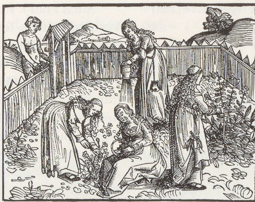
Lob des Kräutergartens: Titelholzschnitt des 1509 in St. Gallen neu aufgelegten «Hortulus» des Abtes Walafrid Strabo aus dem 9. Jh.

« Kräuter und Kräfte » macht deutlich: Die Koexistenz von Schul- und Alternativmedizin besitzt im Appenzell eine lange Geschichte, die noch lange nicht zu Ende ist. Schul- und Alternativmedizin leben hier mit weniger Reibungsverlust als anderswo zusammen, ergänzen, ja beleben einander sogar. Dass es aber sehr wohl Gegensätze gibt, zeigt das Schlusskapitel von Erhard Taverna . Es enthält unter anderem einen