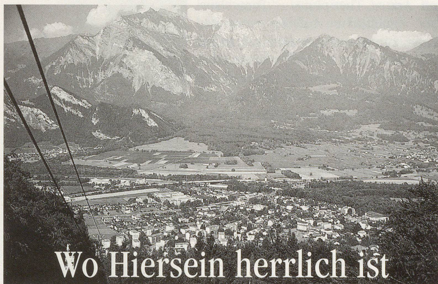
Im Rheintal, zwischen Chur und Sargans, liegt Bad Ragaz auf einer Höhe von 550 m.ü.M.

stärken. Da Parodontitis oft mit einer allgemeinen Abwehrschwäche einhergeht, ist eine Stimulation des Immunsystems wichtig. Eine ausgewogene Ernährung, möglichst ohne Süssigkeiten, und die regelmässige Versorgung mit natürlichem Vitamin C helfen dem gesamten Organismus. Geeignete örtliche Anwendungen sind: Mundspülungen mit Meersalz oder Salbei und Myrrhe (u.a. in A.Vogel's Dentaforce Kräuter-Mundwasser oder -Mundspray); Zahnfleischmassagen mit Echinacea- oder Myrrhe-Ratanhia-Tinktur (z.B. in: Dentaforce Rosmarin-Zahnpasta); Echinacea-Zahnpasta kräftigt und erfrischt das Zahnfleisch, viele massieren sie gerne nach dem Zähneputzen ein. • IZR