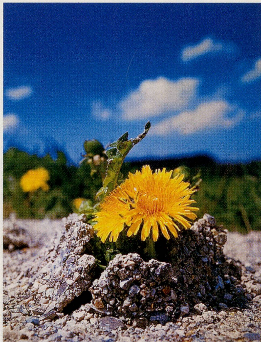
Eine Maxime Alfred Vogels war: Das Gesetz der Natur gebietet, Leben zu erhalten; daher ist es nie zu spät, die Natur in ihrem Heilstreben zu unterstützen.

Medizin zu sich, wenn sie Durchfall oder Würmer haben. Die Menschen fanden die ersten Arzneimittel, mit denen sie sich behandelten, ebenfalls in der Natur. Das grösste Problem bestand darin, durch entsprechende Dosierung die giftige von der heilenden Wirkung zu unterscheiden. Durch Versuch und Irrtum schälte sich in der jahrhundertelangen Tradition der Pflanzenheilkunde nach und nach das richtige Mass heraus.