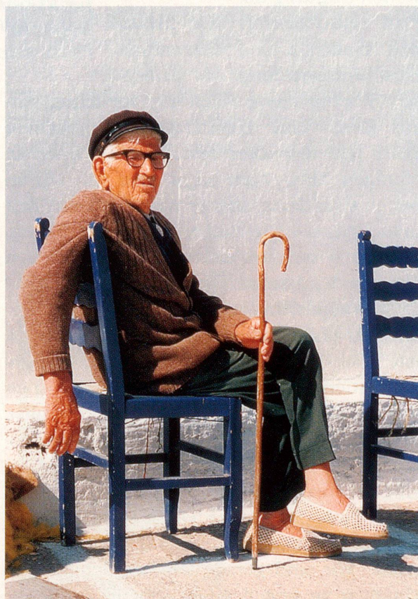
Die «Ausdünnung» des sozialen Netzes macht vielen älteren Menschen zu schaffen.

Griff?» «Auf welche Weise kann ich ihn gut strukturieren?» Letzteres bedeutet, dass man darauf achtet, dass man nicht nur Pflichten und Unangenehmes einplant, sondern auch Dinge, die einen positiv berühren. Momente die ablenken, anregen und angenehm sind. Das wäre so ein erster Block. Meist tauchen hier schon die ersten Gewohnheiten und Vorurteile auf, die es zu verändern gilt. Und sei es nur, dass sich die Teilnehmer nicht mehr merkwürdig fühlen, wenn sie unter der Woche einfach mal so spazieren gehen. Diese Arbeit führt dann zum zweiten Teil, in dem es um Einstellungen, negative Bewertungen und Selbstzweifel geht. Auch um Ziele und Ansprüche, die man vielleicht aufgrund des Alters aufgeben, modifizieren oder korrigieren muss. Der dritte Teil behandelt Themen wie: «Auf welche Weise knüpfe ich neue Kontakte?» «Wie bringe ich mich ein?» «Wie kann ich mich besser abgrenzen, durchsetzen?» Es geht hier also wieder zum Alltagsverhalten zurück.