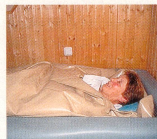
Heilkreidepackung auf Rücken und Knien mit anschliessender druckfreier Lagerung im 40 °C warmen Wasserbett.