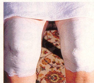
Heilerdepackung an den Knien, auf dem Rücken.