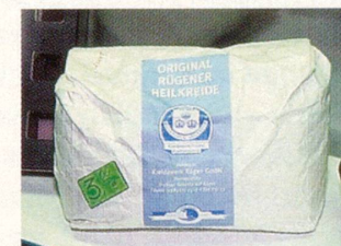
Bezugsquellen für die Heilkreide erfahren Sie über die GN-Redaktion: in CH: Tel. 071 335 66 66 in D: Tel. 07533 40 35