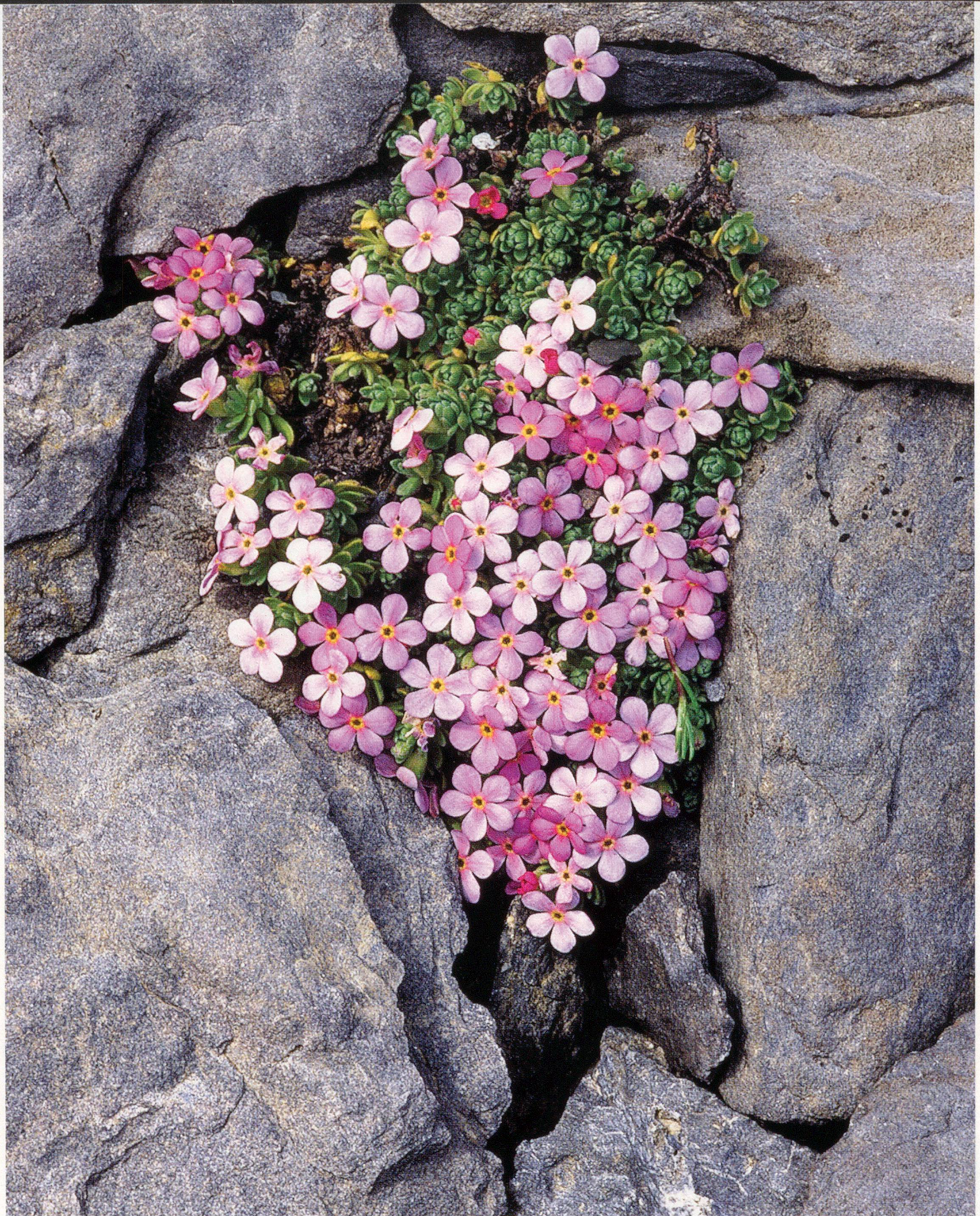
Bild des Monats - (Über-)lebenskünstler: Alpen-Mannsschild ( Androsace alpina )