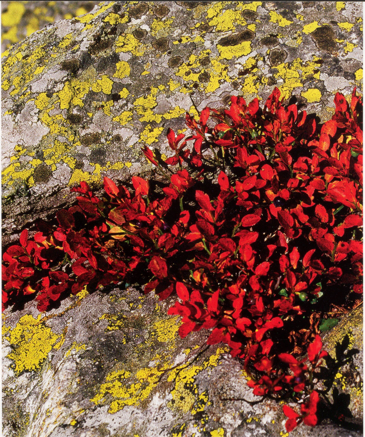
Bild des Monats – (Über-)lebenskünstler: Die Heidelbeere ( Vaccinium myrtillus ) findet selbst in einer Felsritze ihren Platz.